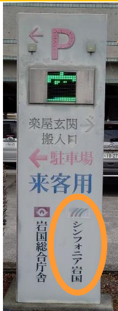
駐車場出入口前道