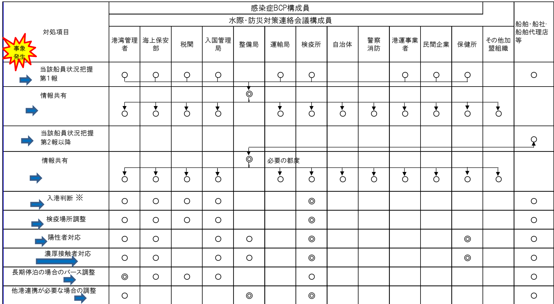
表4-2 各フェーズにおける対応及びその主体