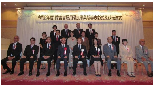
<障害者雇用優良事業所等表彰式>