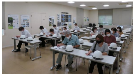
<職場リーダー養成講座(企業見学会)>