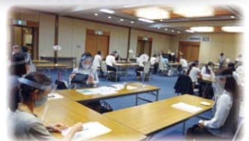
〔昨年の座談会の様子〕