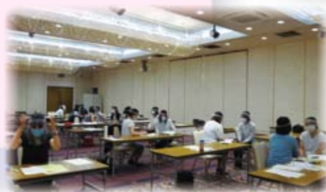
〔昨年のメンター研修の様子〕