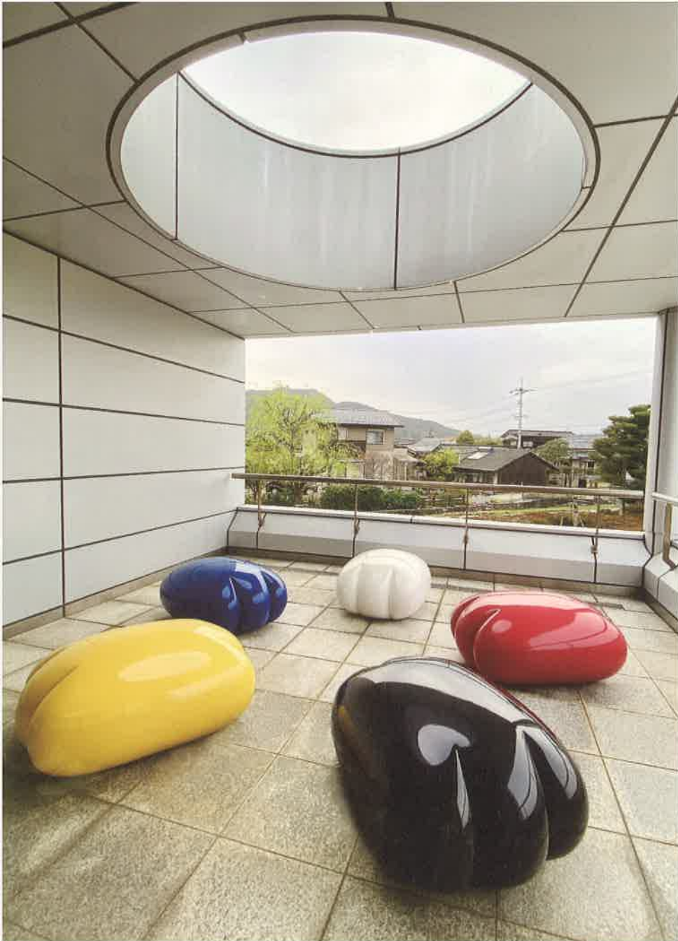
ふわふわ5！ 2011年（各w.1000-d.800-h.550mm） 素材：FRP 茨城県陶芸美術館蔵