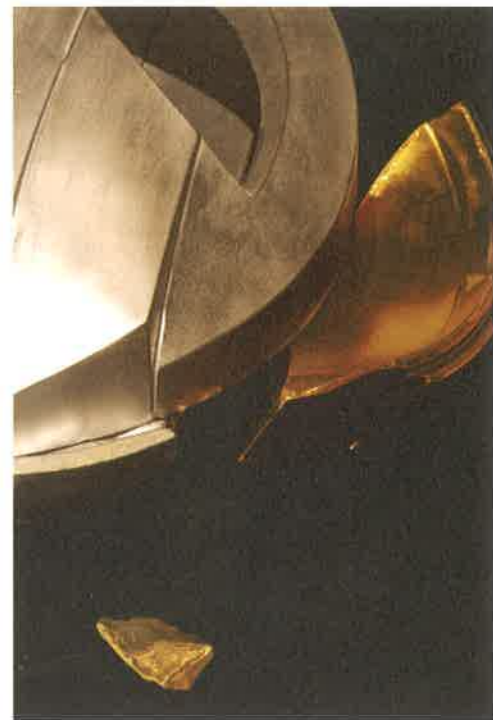
Energy Explosion (部分) 2020年 (w.800-d.800-h.130mm 台座を含む)