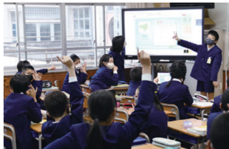
山口市立小郡南小学校