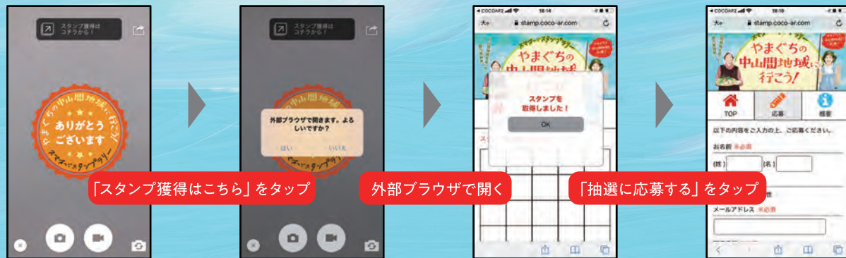
スキャン完了画面