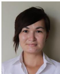
バレンティーナ ポトホエバ