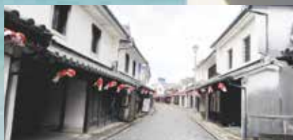
金魚ちょうちん・白壁の町並み