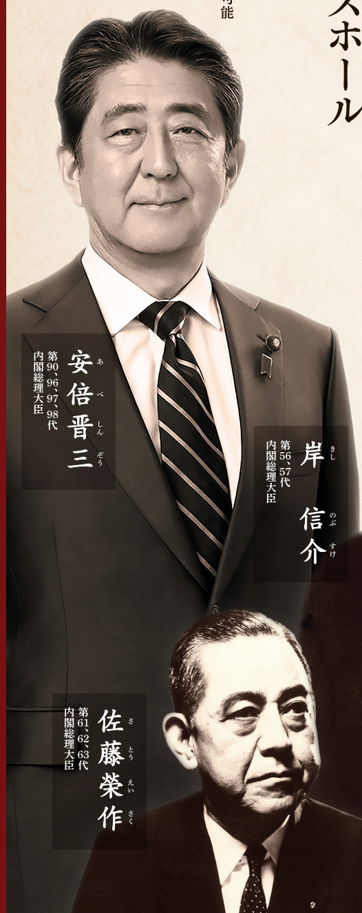
安倍晋三 第90、96、97、98代 内閣総理大臣