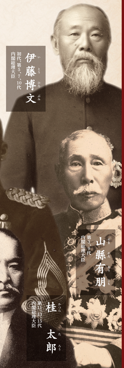
伊藤博文 初代、第5、7、10代 内閣総理大臣