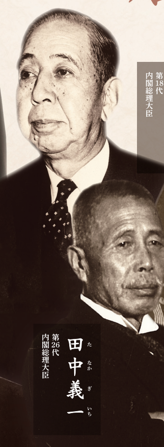
寺内正毅 第18代 内閣総理大臣