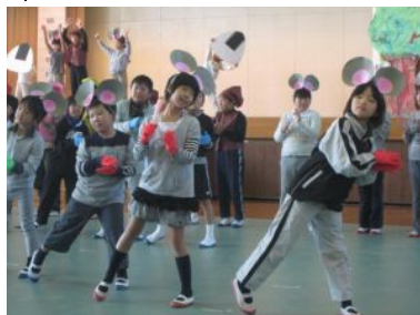
★小学校の全校児童による英語劇「おむすびころりん」