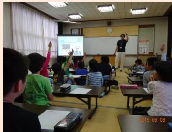
段ボールコンポストの取組