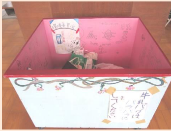
牛乳パックの回収