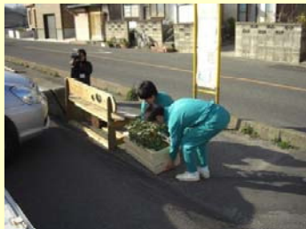
プランターの設置