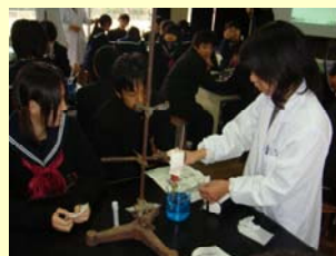
高等専門学校との連携授業