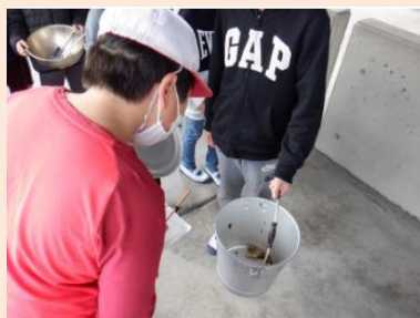
給食残量調査の実施