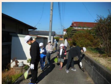
地域クリーン活動