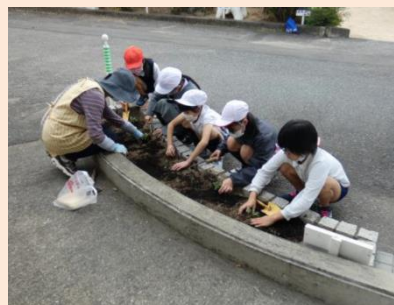
花壇コンクールの花の苗植え