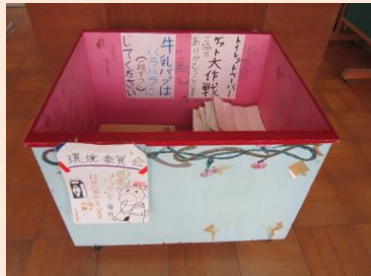
牛乳パックの回収