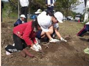
さつまいもの苗植え