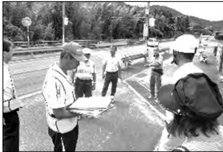
宇部市立厚東中学校・地域

地域、保護者、教職員と一緒に通学路の安全確認を行い、それをもとに夏休みにクリーン大作戦で、除草作業を行った。