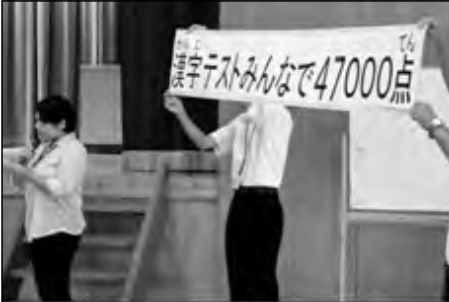
周南市立富田東小学校 富田中学校

中学校のテスト週間に合わせて、「家庭学習がんばり週間」を行った。家庭とも連携し、小中共通の課題である「家庭学習の定着」のために、宿題忘れゼロ、漢字テスト全校で47000点をめざした。