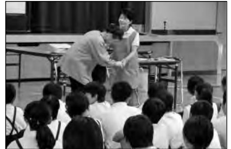
柳井市立大島小学校

地域に貢献することをめざして、4年生以上の児童と地域の方が参加して認知症サポーター養成講座で認知症について学んだ。