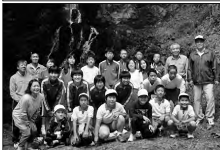
山口市立中央小学校・島地小学校 串小学校・八坂小学校 柚野木小学校・徳地中学校

徳地の5地区に分かれ、小・中学生が地域の方に見守られてボランティア活動に取り組んだ。