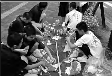
柳井市立柳井中学校

金魚ちょうちん祭りでは、金魚ちょうちんの設置・撤収の役割を部活動毎に分担し、地域のお祭りをスタッフとして支えた。