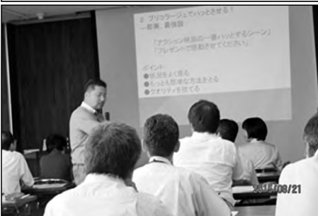
【日置みすゞ学園】長門市立日置小学校 神田小学校・日置中学校

日置みすゞ学園では、夏季研修会に各校の教職員と学校運営協議会委員が参加して講演を聴き研修に努めた。