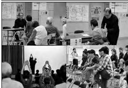
下関市立内日中学校

運動療法の専門家を学校に招き、地域の方を対象にした健康相談や、生徒と合同の体力づくり教室「チャレンジ教室」を開催した。