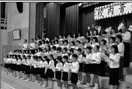
山口市立陶小学校 地域・保護者・児童・教職員

校内音楽会において地域・保護者・教職員の有志で結成したコーラス隊と児童が、地域のめぐり歌などを合唱した。