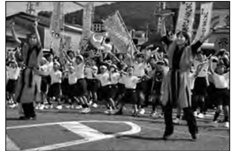
光市立三井小学校

光まつりパレードに児童有志が参加して、「地域の輪から実現する夢」をアピールした。