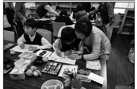
周南市立八代小学校

3月下旬の平日の午後、全校生徒が地域各所に出向き、「ピカピカデイ」という名のボランティア活動を行っている。