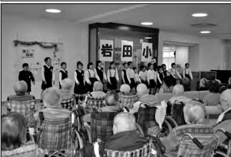
光市立岩田小学校

光まつりパレードに児童有志が参加して、「地域の輪から実現する夢」をアピールした。