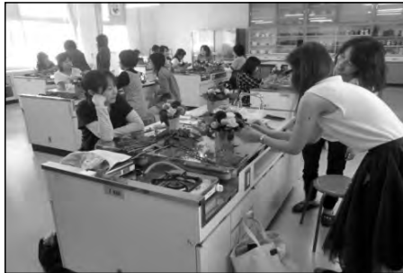
周南市立富田中学校

学校応援団会員を講師に、保護者を対象に、フラワーアレンジメント教室を調理室で実施し、作品を翌日の文化祭で展示した。