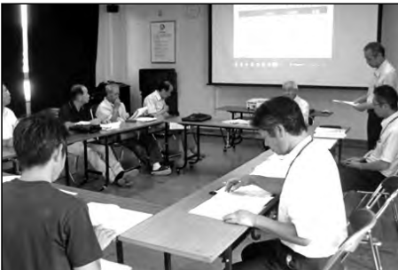
周南市立久米小学校・櫛浜小学校 太華中学校

太華中学校区全体で「ノーメディアチャレンジ週間」を設定し、学校運営協議会で意見をいただきながらメディアに関する指導を行った。