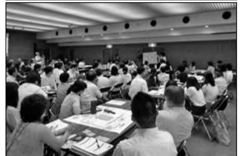
周南市立遠石小学校・周陽小学校 桜木小学校・周陽中学校

周陽中学校区内の3小学校の全教員とそれぞれの学校運営協議委員が一堂に会して合同で熟議を行った。