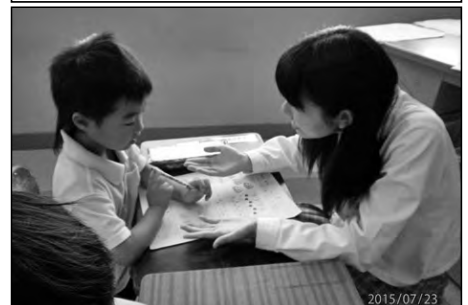
光市立浅江小学校・浅江中学校 光丘高等学校

夏休みの初めと終わりにサマースクールを実施し、地域の方、光丘高校、浅江中学校の教員、生徒が算数と水泳の学習支援を行った。