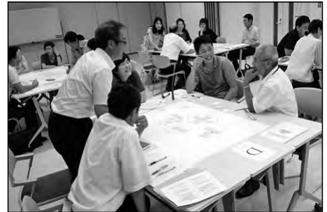
上関町立上関小学校・祝島小学校 上関中学校

コミスク委員、教職員、保護者、地域住民による熟議を行い、上関で育てたい子どもの姿を共有した。