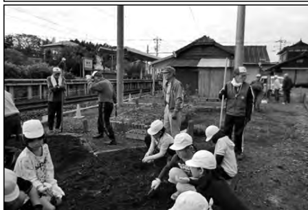
宇部市立原小学校

5年生が、11月に地域の方と妻崎駅周辺の花壇を整備した。土を耕し、花の苗を植えた後も自主的に随時水やり等、継続して花の世話をしている。