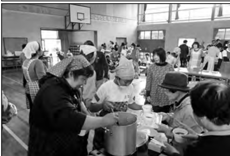
下関市立栗野小学校

学校を地域に開放した青空市場で、全児童・保護者が地域の方々へのおもてなしを行った。