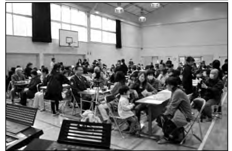
山口市立八坂小学校

地域の方々に、学習発表や合奏等で感謝を伝える「感謝とふれあいの会」の最後に、鉢植えの花とともに感謝の言葉を贈った。