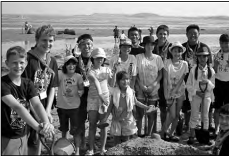
宇部市立東岐波小学校 東岐波中学校

小中学生が世界のスカウトと交流し、AFPYやアサリ掘り、サンドアートなどの活動を通して、楽しく過ごした。