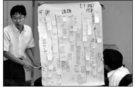
宇部市立原小学校・黒石小学校 黒石中学校

夏休みに三校合同で校区のめざす児童生徒像について職員及び学校運営協議会の委員で熟議を行った。