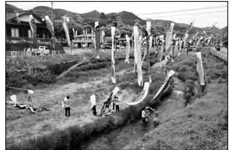
山口市立仁保中学校

仁保川を彩るこいのぼりの掲揚を4月4日に行い、その片付けを5月6日に実施した。15名の生徒が参加し、こいのぼりの掲揚や取り外し、色別の分類等に取り組んだ。地域の伝統文化を理解するよい機会となり、地域貢献の気持ちを育むことができた。