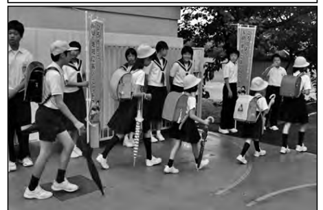
周南市立今宿小学校・住吉中学校

小中連携の活動として、中学生が朝の登校時に、小学校に出向き、「朝のあいさつ運動」を小学生と一緒にやった。