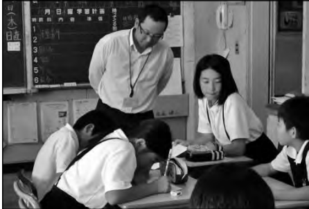
岩国市立東小学校・東中学校

週に1回のペースで、東中の数学の教員が小学校を訪問し、6年生の算数の学習においてTTによる支援を展開している。