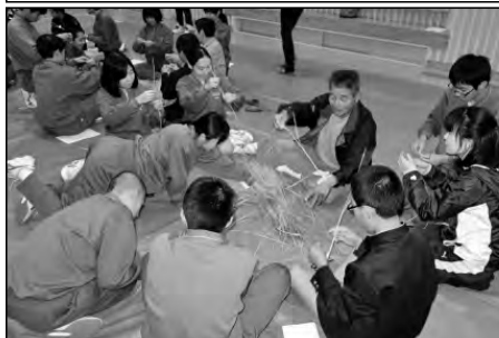
山口市立阿東中学校

校区内の二つの小学校の児童と一緒に「トイトイ」のわら馬づくりを習い、小中合同での地域の伝統文化継承活動に取り組んでいる。