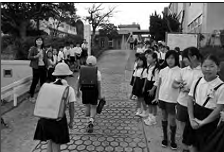
下関市立川中中学校・熊野小学校 川中中学校

川中中学校区ふるさと協育ネットの共通の取組としてあいさつ運動を行っている。キャッチフレーズは「0のつく日はあいさつの日」、本校では各クラスで日にちを決めて活動している。また、自主あいさつ隊「あいさつレンジャー」は毎日活動している。