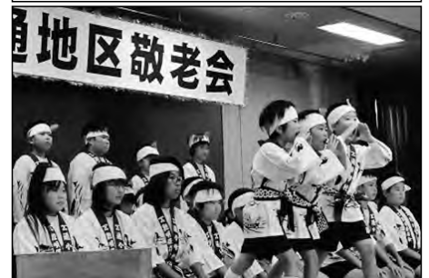
長門市立通小学校

全校活動で行っている地域の伝統行事「鯨唄」を、通地区敬老会で発表して、地域の皆さんにも喜ばれた。