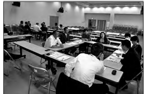
下関市立垢田中学校区

垢田中学校区では、3校の学校運営協議会と校内組織を知・徳・体の3部会に分け、合同で研修会を行っている。