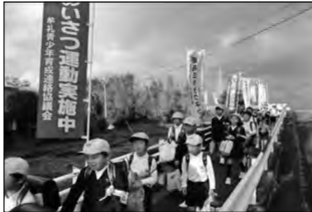
防府市立牟礼南小学校

「牟礼ミラタクネット」で11月をあいさつ月間として、牟礼地区全体で取り組んでいる。のぼり旗を通学路に立てて意識を高め、学校では、児童会を中心にあいさつ運動に取り組んでいる。