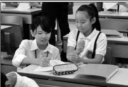
下関市立生野小学校・山の田小学校 下関市立大学

校区内の下関市立大学を会場に、山の田小・生野小が「算数大作戦」を実施し、小学校の教員に加え、教職課程の学生40名が5年生児童を支援した。