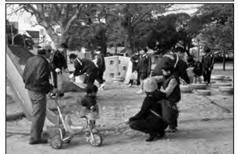
周南市立住吉中学校

地域に貢献する活動として、生徒会の主催で「クリーン作戦」を行い、全校生徒と教職員で、日頃使っている公園や通学路の歩道等の清掃活動を行った。