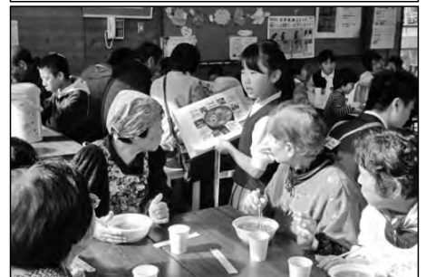
岩国市立周北小学校

地域の方々と「ふれあい参観日」を開催した。児童が栽培した野菜、大豆から作った豆腐、つくたての餅の入った豚汁の味は最高だった。