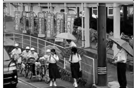
岩国市立灘中学校区

灘地区協育ネット協議会の「こころとからだの部会」が中心となり、地区一斉あいさつ運動を実施している。(学期に2回)