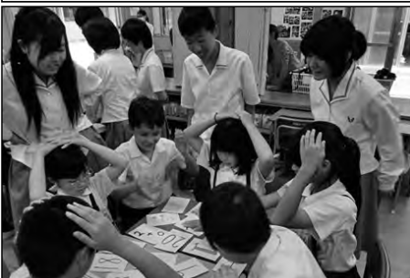
下松市立花岡小学校 華陵高等学校

5年生児童は、山口県立華陵高等学校の英語科の生徒と学期に一度ずつ「合同プロジェクト」と題して、外国語活動に取り組んでいる。