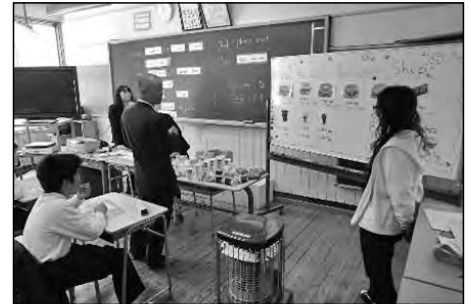
萩市立木間中学校

A L Tとの授業を地域の公開講座として行い、中1と地域の方が一緒に英会話の学習に取り組んだ。