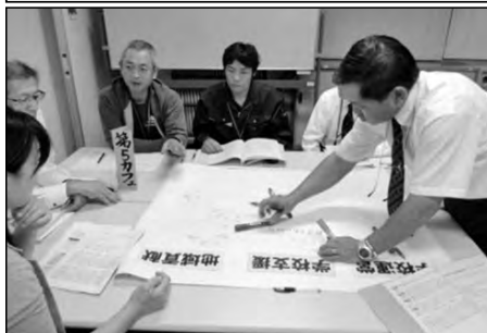
【深川みすゞ学園】長門市立深川小学校 向陽小学校・深川中学校

深川中学校区「深川みすゞ学園」の合同の学校運営協議会では、3校の運営協議会委員が一堂に会し「保護者・地域の多くの人が集まる深川みすゞ学園にするには」について協議した。