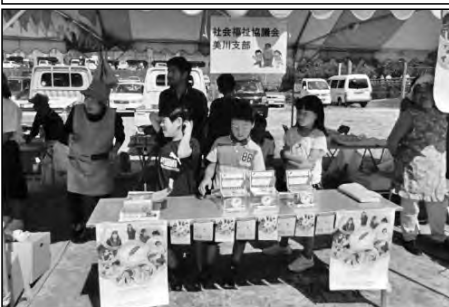
岩国市立美川小学校

美川ふるさとまつりに全校行事として参加し、ステージで歌ったり、募金活動の手伝いをしたりして、祭りを盛り上げた。