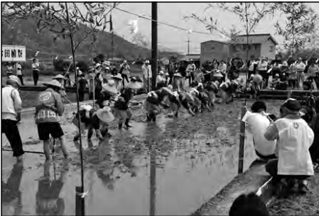
防府市立右田小学校・右田中学校

右田小学校児童とともに、40名の右田中学校生徒が地域伝統行事「右田お田植祭」の神事に加わり、田植えを行った。