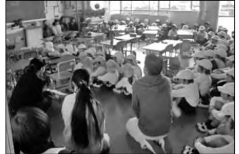
周南市立福川南小学校 福川南幼稚園・地域

地震後津波が来た想定で、幼稚園、保護者、地域住民と一緒に、校舎3階の教室に避難する訓練を実施した。