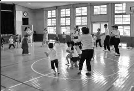
周南市立中須中学校・中須保育園

学校行事を常に地域、保育園に開放。青少年劇場では休校中の小学校講堂で開催し、保育園児と一緒に活動した。