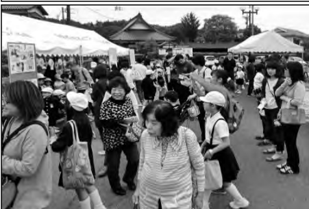
周南市立鹿野小学校

町興しを目的に行われている地域の祭り『鹿野市』に、鹿野小学校全員で手作り商品を出店し、合唱を披露して、大いに盛り上げた。