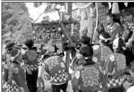
周防大島町立情島小学校・情島中学校

地域の秋祭りでは、中学生が重要な御輿の担ぎ手となっている。小学生も太鼓をたたいたり、みこを務めたりして祭りを盛り上げた。