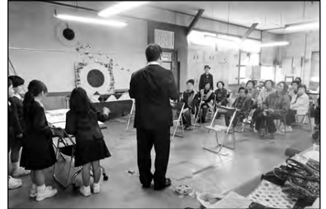
岩国市立本郷小学校・本郷中学校 地域

学校コーディネーターが中心となり、地域の方が自由に来ることができる喫茶コーナー「ひまわりカフェ」を設置し、児童生徒や教員との交流も行っている。この日は、小学生が業間時間を利用して訪問し、国語で作った物語を発表した。