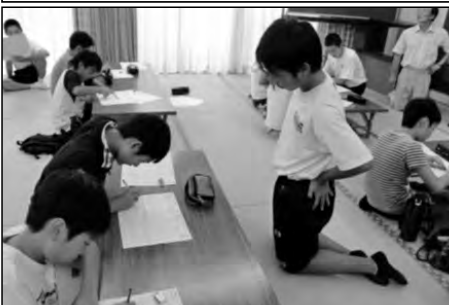
下関市立菊川中学校区

夏季休業中に小学生への学習支援を中学3年生が地域の方と協力しながらサマースクールを行った。中学生へは、地域の方と小中の教職員が行った。