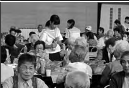
山陽小野田市立竜王中学校

敬老会にボランティアとして参加し、お年寄りの方一人ひとりに、全校生徒が作成したしおりをプレゼントした。