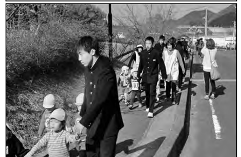
長門市立明倫小学校・三隅中学校 三隅保育園

三隅中学校区では、地域と小中学校・保育園が合同で災害時の避難訓練を行い、避難方法や各自の役割を確認し合った。