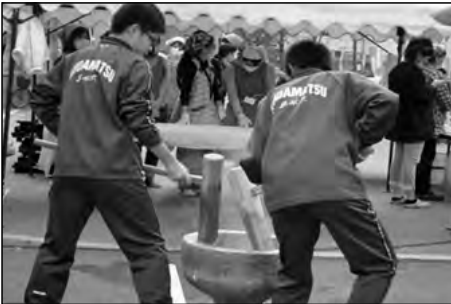
下松市立下松中学校

中学生が下松中央公民館祭りにボランティアとして参加し、餅つきや物品の販売、ゲーム等をして祭りを盛り上げた。