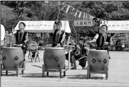
岩国市立柱野小学校

運動会で柱野太鼓を演奏し、児童にふるさとを愛する心を育成したり、地域に元気を届けたりした。