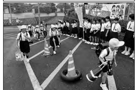
周南市立秋月小学校・秋月中学校

須々万中学校区の合同学校運営協議会で、あいさつの活性化に向けた話し合いを行った。