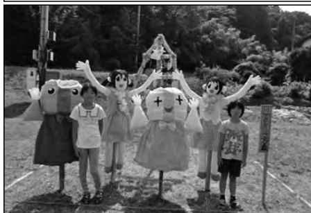
山口市立嘉年小学校

中学生が計画した小中合同のボランティア活動で、小学生が中学生や地域の方と一緒に駅の清掃を行った。