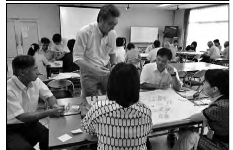
山口市立陶小学校・名田島小学校 鑄銭司小学校・湧上中学校

湧上中学校区地域協育ネット協議会の委員や学校教職員による「熟議」を行い、「めざす子ども像」について話し合った。