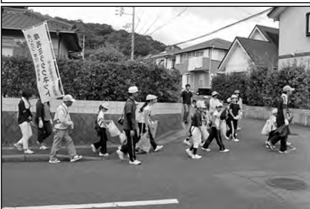
防府市立牟礼小学校

土曜授業時に、全校児童が縦割り班に分かれ、保護者や学校運営協議会委員と一緒に地域を巡り、ごみ拾いを行った。