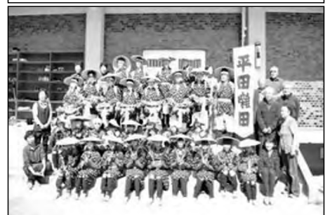
岩国市立平田中学校

毎年開催される「岩国民俗芸能まつり」で平田中学校区の児童生徒と地域の保存会の方で「平田灘田」を演じており、地域の伝統文化の継承活動に取り組んでいる。