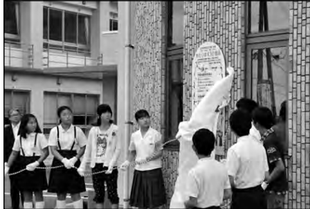
山口市立小鯖小学校・大内小学校 大内南小学校・大内中学校

学校生活をよりよくするために、小中学生自らが「あたりまえ10箇条」を考え、地域も応援するために看板を作り、除幕式を行った。