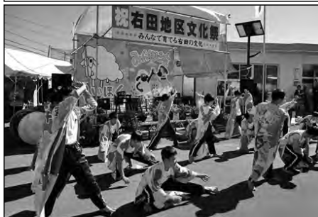
防府市立右田中学校

1・2年生のボランティア18名が、右田地区文化祭ステージ部門に出演し、よさこいソーラン節を披露した。