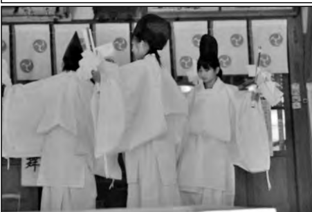
美祢市立淳美小学校

6年生が、夏休みから地域の神楽保存会の方から指導を受け、地域の八幡宮の秋祭りで奉納している。地域の伝統を引継ぎ、祭りを盛り上げている。