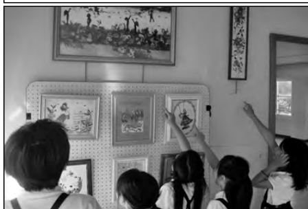
防府市立勝間小学校

勝間公民館で行われている「ちぎり絵」「押し花」など、講座で作成された作品を校内のスペースを工夫して展示し、児童が鑑賞している。作品を鑑賞しての感想を公民館に届けることで、地域の方々との交流の輪が広がっている。