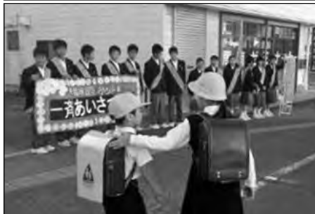
周南市立徳山小学校・遠石小学校 岐山小学校・岐陽中学校・地域

校区一斉あいさつ運動が年に3回実施されている。本校生徒が校区三つの小学校や人通りの多い道路に出かけ、あいさつ運動を行った。地域の方や保護者の方も毎回参加され、地域を挙げてのあいさつ運動に発展しつつある。