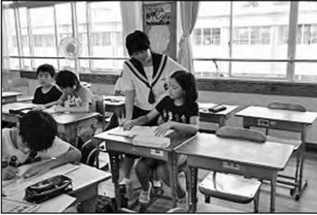
宇部市立西宇部小学校 厚南中学校

夏休みのサマースクールに、中学生が先生として5・6年生の学習を支援する活動を行った。