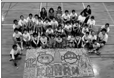
周南市立鼓南小学校・鼓南中学校 鼓南児童園・地域

学校・家庭・地域が連携し4年生による4泊5日の通学合宿を行った。24名の児童は仲間との共同生活で友情を深めた。