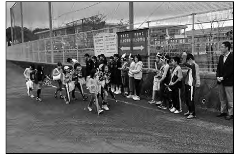
宇部市立川上小学校・川上中学校

地域の方々のあいさつ運動にあわせ、小学校児童会と中学校生徒会の執行部が、正門付近で朝のあいさつ運動を実施した。