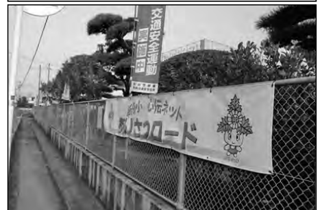
防府市立新田小学校・PTA・地域

地域・PTA・学校の三者が連携し、学校の周りをあいさつロードに指定し、出会った人同士があいさつを交わすようにした。学校は、キャラクターのデザインを募集し、自治会は、趣旨を地域に呼びかけ、PTAは、土曜授業日に保護者があいさつに立つという形で連携している。