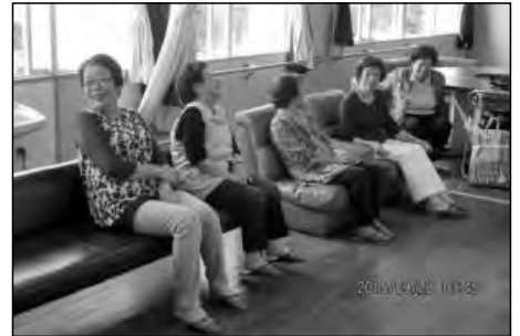
防府市立国府中学校

コミュニティルームを開設し、公民館を通じて地域の方々の作品展示を行うとともに、授業も参観していただいた。