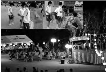
下松市立久保中学校

久保地域の盆踊り(さんさ踊り)に、ボランティアとして、太鼓の演奏や会場清掃スタッフとして中学生が参加した。