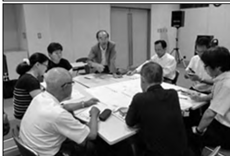
【油谷みすゞ学園】長門市立油谷小学校 向津具小学校・菱海中学校

油谷みすゞ学園では、教職員と学校運営協議会委員が参加して合同の学校運営協議会を実施した。熟議を通して、課題を共有し今後の取組について見通しをもつことができた。