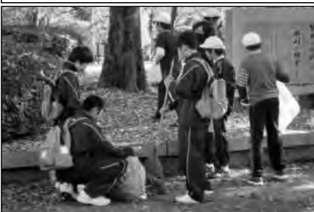
岩国市立岩国中学校区

岩国中学校区の小学校と合同で、日頃使用している地域の公園等の清掃活動を行い、交流を深めた。