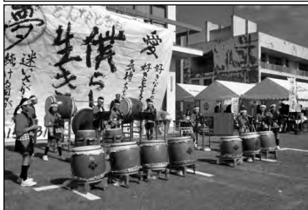
岩国市立高森小学校

周東町中央地区文化祭の催しの部で、高森小学校遊撃軍太鼓が勇ましい太鼓演奏を発表し、祭りを盛り上げた。