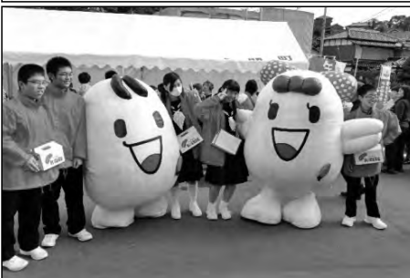
上関町立上関中学校

高齢者を招待して、体力測定を実施した。学校運営協議会の委員をはじめ、地域のお年寄りがたくさん参加した。