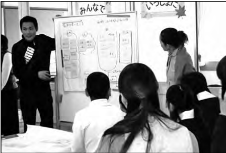
光市立塩田小学校

「塩田夢プラン」づくりとタイアップし、児童、保護者、地域の方々が一緒になって「塩田のよいところ、あったらいいなと思うもの」についてワークショップをした。