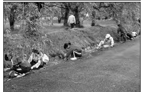
山口市立阿東東中学校

校区内の二つの小学校の児童と一緒に「トイトイ」のわら馬づくりを習い、小中合同での地域の伝統文化継承活動に取り組んでいる。