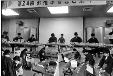
美祢市立於福中学校

2年生が於福民踊倶楽部の方々や こと 箏の先生を講師に招いて着物の着付けと箏を体験した。学んだ箏は地域の「ふるさと祭り」で披露した。