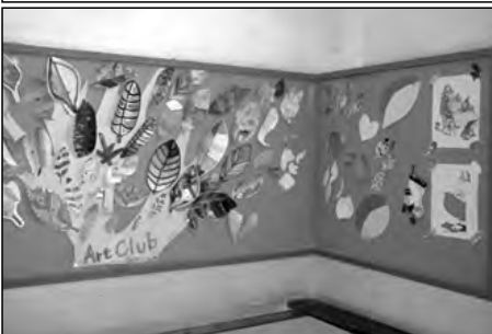
宇部市立恩田小学校

「里海再生の会」と協力して海の調査を行い、アサリの増加を確認できた。1月に、海岸整備のためのマツの植林を予定している。