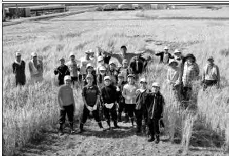
岩国市立米川小学校・地域

地域の人と連携して、田んぼアクトに取り組み、6月に田植え、10月に稲刈りを行った。