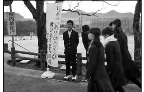
下関市立勝山中学校

勝山地区夢プロジェクトとして、勝山地域の幼保小中を含む関係団体が一体となり、「日本一『ありがとう』の飛び交う町勝山」を推進することとなった。