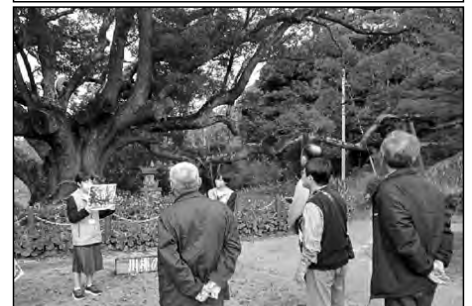
下関市立夢が丘中学校

運動療法の専門家を学校に招き、地域の方を対象にした健康相談や、生徒と合同の体力づくり教室「チャレンジ教室」を開催した。