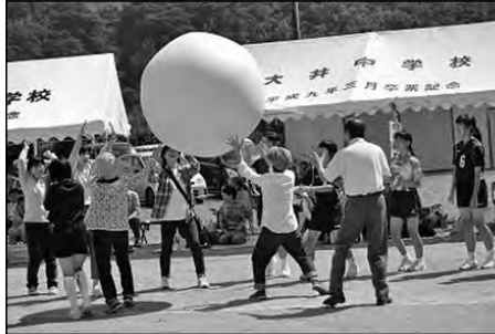
萩市立大井小学校・大井中学校

大井小中合同運動会にコミュニティ競技のプログラムを設け、学校運営協議会が中心となって競技の運営を行った。