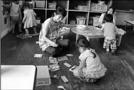
美祢市立伊佐小学校・伊佐保育園 伊佐中央幼稚園

校内研修として夏季休業中に幼稚園・保育園体験研修を行っている。就学前の児童の様子も把握できるよい機会となっている。