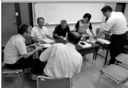
周南市立須磨小学校・沼城小学校 須々万中学校

須々万中学校区の合同学校運営協議会で、あいさつの活性化に向けた話し合いを行った。