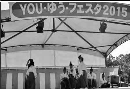
岩国市立由西小学校

神楽の練習の成果を地域の神楽指導者とともに由宇地域のイベントで披露し、イベントの盛り上げりに貢献した。