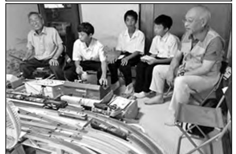
山口市立宮野中学校

毎月1回一人暮らしの高齢者宅を民生児童委員の方と一緒に訪問し、昔の遊びの話や趣味を話題にしながらコミュニケーションを深めている。