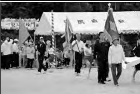
岩国市立中田小学校

公民館、地域、周東中学校(本校卒業生)と連携をして、全員で役割分担をして運動会を実施した。