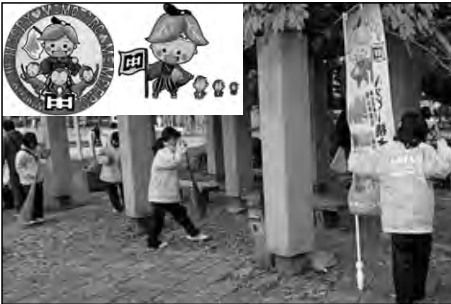
宇部市立桃山中学校

ボランティア活動を積極的に推進するために「ハッピー桃太郎プロジェクト」を立ち上げた。生徒にマスコットキャラクターを募集し、のぼり旗やステッカーを作成し、活動の場面を盛り上げた。