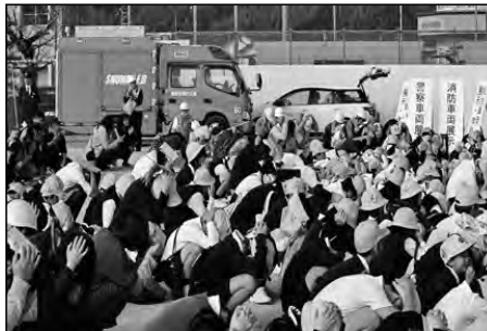
周南市立戸田小学校 市・地域・保護者

市の防災訓練に全校児童が参加した。地域、保護者と協働した活動で、防災意識を高めることができた。