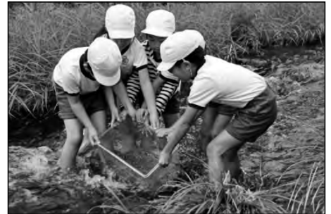
山口市立大殿小学校

ふるさと伝承センターの飼育専門員の指導のもと、地域の皆さんや保護者とともに、親ポタル採取・カワナ採りなどを経て、「ホタル(幼虫)放流の集い」を行った。