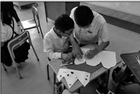
光市立塩田小学校・三輪小学校 岩田小学校・東荷小学校・大和中学校

「小中ふれあい交流学习」と題して、中学生が校区内の四つの小学校にリトルティーチャーとして訪れた。