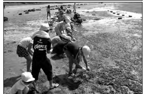
宇部市立東岐波小学校

「里海再生の会」と協力して海の調査を行い、アサリの増加を確認できた。1月に、海岸整備のためのマツの植林を予定している。