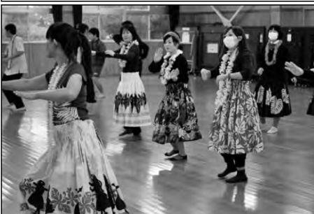
萩市立萩東中学校

11月に「公開講座」を開催し、学校を「大人の学びの場」としている。当日は、11講座を開講し、216名の保護者や地域の方が参加された。