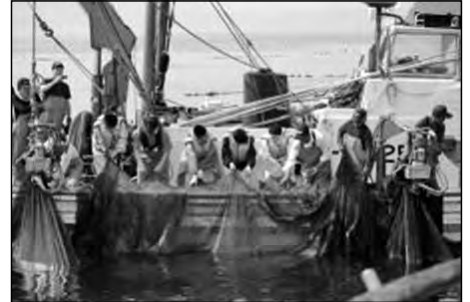
萩市立大島小学校・大島中学校

中学生が大敷網漁の体験によりとれた魚を漁業協同組合女性部の指導により、実際に調理し、全校児童生徒と地域の方々で会食して、つながりを強めている。