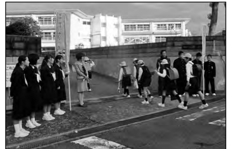
周南市立周陽小学校・周陽中学校

中学校が主体となったあいさつ運動に合わせて小学校もあいさつ運動を行った。地域に笑顔とあいさつの輪が広がった。