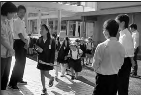
山陽小野田市立有帆小学校・高千帆小学校 高泊小学校・高千帆中学校

地域の方々のあいさつ運動にあわせ、小学校児童会と中学校生徒会の執行部が、正門付近で朝のあいさつ運動を実施した。