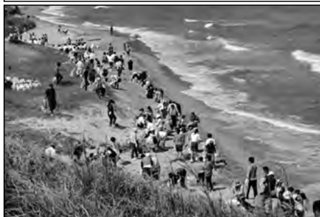
長門市立菱海中学校

保護者や地域住民と大浜海岸清掃を行っている。油谷中学校が昭和48年から始めた取組を学校統合後も継続している。 今年度で48回目になり国土交通大臣表彰を受けた。