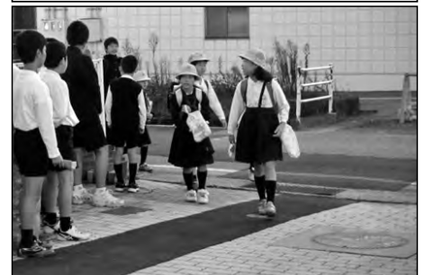
山口市立良城小学校・大歳小学校 鴻南中学校

校区内の幼稚園、保育園の年長児が来校し、2年生と交流を行ったり、給食を試食したりした。