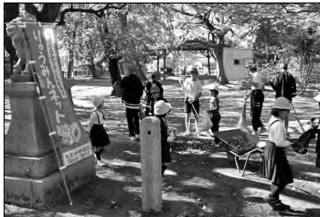
山陽小野田市立本山小学校 赤崎小学校・竜王中学校・松原分校

竜王中学校区で、通学路や神社、公園などの清掃活動。児童と一緒に地域の方々も参加して一斉に行っている。