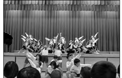
周南市立鹿野小学校・鹿野中学校 鹿野幼稚園・鹿野保育園

今年度から新たに保育園も参加して、鹿野の幼稚園、保育園、小学校、中学校と一緒に『鹿野幼保小中合同文化祭』を行った。