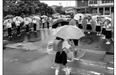
山口市立秋穂小学校・大海小学校 秋穂中学校

中学生が母校に行き、地域協育ネット関係者や教職員と、元気に小学生の登校を迎える「秋穂あいさつ運動」を行った。