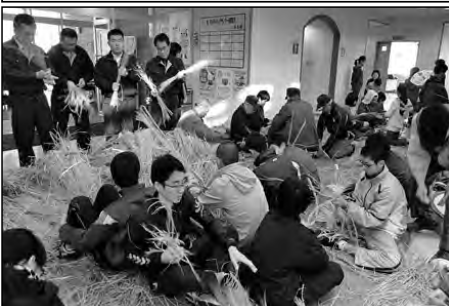
萩市立明木小学校・明木中学校

小学生・中学生・地域住民が協力して、大しめ縄をつくり、石の巻山頂上の巨石に設置した。