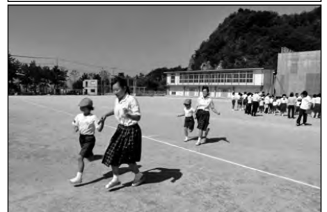
萩市立越ヶ浜小学校・越ヶ浜中学校

津波を想定した避難訓練を小中学校合同で開催し、小学校の低学年児童と中学生と一緒に避難するなど、避難方法を確認し合うことができた。