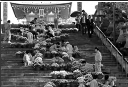
防府市立佐波中学校

5月の「幸せますウィーク」での防府天満宮の花回廊の手入れは、本校生徒が行う恒例のボランティア活動として定着している。