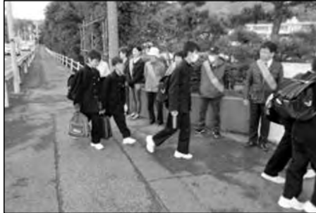
周南市立福川小学校・福川南小学校 福川中学校

中学校のテスト週間に合わせて、「家庭学習がんばり週間」を行った。家庭とも連携し、小中共通の課題である「家庭学習の定着」のために、宿題忘れゼロ、漢字テスト全校で47000点をめざした。