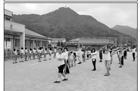
萩市立椿西小学校

夏季休業中に地域にも参加を呼びかけラジオ体操コンクールに出場した6年生を中心に、合同ラジオ体操を実施し、日常化を進めている。