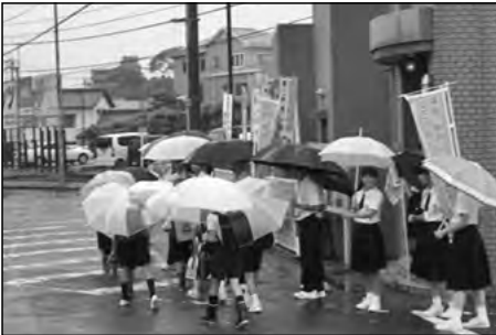
周南市立周陽中学校