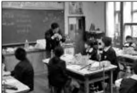
美祢市立嘉万小学校・別府小学校 秋芳北中学校