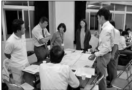
周防大島町立安下庄小学校 安下庄中学校

小中学校の全教職員・学校運営協議会委員・PTA代表等が集まって熟議を行い、四つのテーマを設定した。