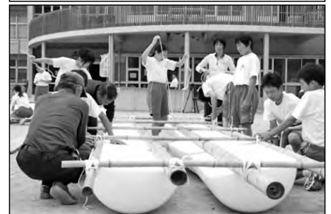
阿武町立阿武中学校

保護者や地域住民と大浜海岸清掃を行っている。油谷中学校が昭和48年から始めた取組を学校統合後も継続している。 今年度で48回目になり国土交通大臣表彰を受けた。