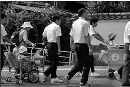
防府市立富海小学校・富海中学校 富海保育園

児童生徒・園児が、地域の方々と共に地震・津波を想定した避難訓練を行い、防災意識を高めた。