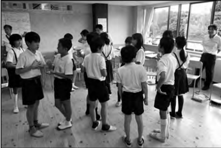
下関市立栗野小学校・滝部小学校 豊北中学校

豊北中学校の英語教師と栗野小学校校長とのTTで栗野小・滝部小学校の児童と一緒に外国語活動の授業を行った。