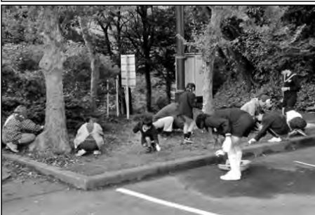
山口市立生雲小学校・さくら小学校

中学生が計画した小中合同のボランティア活動で、小学生が中学生や地域の方と一緒に駅の清掃を行った。