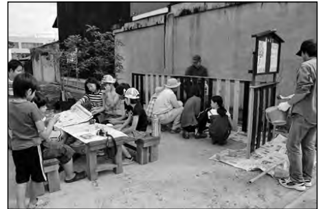
山陽小野田市立厚狭小学校

5年生が厚狭のまちづくりグループ「厚狭杜のまち」の皆さんと「ポケットパーク」2号地づくりを行った。