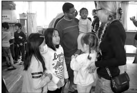
岩国市立通津小学校

平成27年度にコミュニティルームを開設した。11月7日には、ここで本校児童と米軍岩国基地のペリースクールの児童・保護者との国際交流会を実施した。