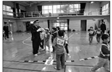
下関市立名池小学校・名陵中学校 名池保育園

「よりみちひろば」という地域、保護者のボランティア団体と共に、家庭、地域、名池小、名池保育園、名陵中の連携・協働による「おもいパーティー」、 「スポーツチャンバラ」、 「よりみちまつり」などのイベントを通して、子どもたちの健全育成を図った。