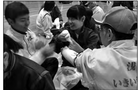
光市立浅江中学校

中学校と浅江地区自主防災会が連携して、防災模擬訓練を行い、実際の場面を想定しながら、災害時に備えている。