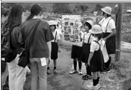
美祢市立秋吉小学校

3年生から6年生までが総合的な学習で地域のすばらしさを学習し、その学習成果を秋吉台に来ていた方々へ、子どもガイドとして発表した。