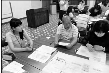
美祢市立東厚小学校・川東中学校 厚保小学校・厚保中学校

厚保地区小中学校全教職員と学校運営協議会委員の合同研修会で熟議を実施。厚保地区のめざす児童・生徒像、そのための取組について、熱く語り合った。