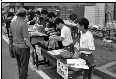
岩国市立東中学校

地域主催の土曜夜市で、出店される店の手伝いや、会場に出されるごみの収集などボランティアとして参加し、地域に貢献した。