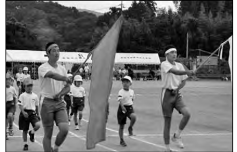
美祢市立豊田前小学校 豊田前中学校

昨年度から、小中合同運動会準備委員会を立ち上げ、プログラムの内容等を中心に検討を重ね、9月12日(土)に第1回豊田前小中合同運動会を、保護者をはじめ地域の方々にも多数来校していただき実施した。