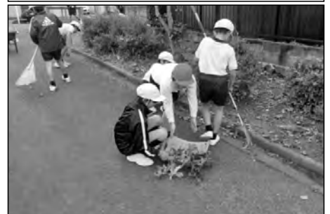
下松市立東陽小学校

東陽小クリーン作戦として、持久走大会前後に、コースの清掃や落ち葉拾いをして、地域の環境整備に取り組んでいる。