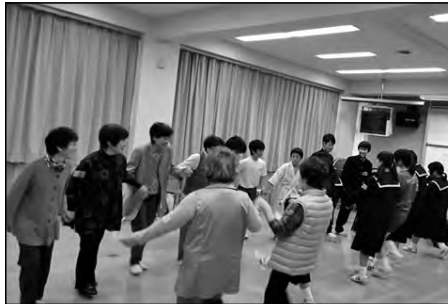
山口市立二島中学校

5班に分かれて老人施設や独居高齢者宅の訪問、未就園児サークルや放課後児童クラブの支援、地域住民との交流会などのボランティア活動を企画・立案し、実行した。