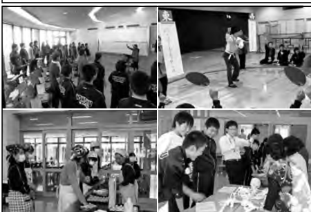
下関市立豊北中学校

地域公開講座として、豊北町在住のその道に長けた指導者を講師に迎え、1年生と地域の方が一緒に学習に取り組んだ。