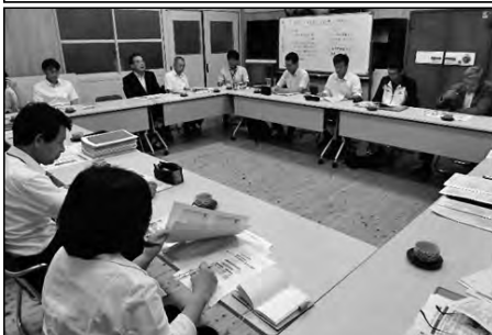
萩市立明倫小学校・白水小学校 萩西中学校

萩西中学校区小中合同の学校運営協議会を開催して、共通テーマや共通取組事項など、熟議をしながら連携体制を整えた。