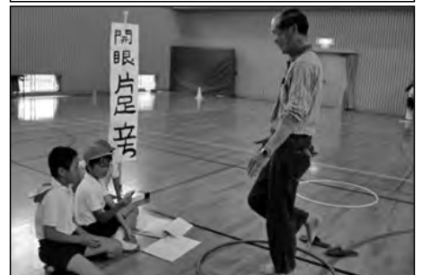
周防大島町立島中小学校

高齢者を招待して、体力測定を実施した。学校運営協議会の委員をはじめ、地域のお年寄りがたくさん参加した。