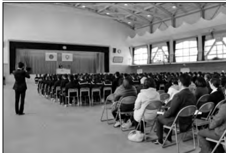
平生町立平生中学校

「立志の集い」は、青少年育成町民会議、教育委員会、学校が協働して実施している。全校生徒が参加して、保護者、地域の方の同席のもとで、2年生一人ひとりが、誓いの発表を行い、社会的自立をめざすための意欲を高めている。