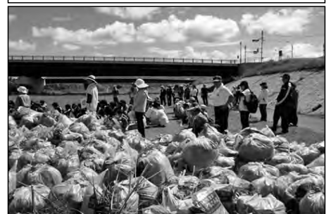
防府市立華城小学校

華城小校区の中学校生徒会が中心となって行う佐波川清掃に、児童・保護者が自主的に参加し、草刈りに汗を流した。