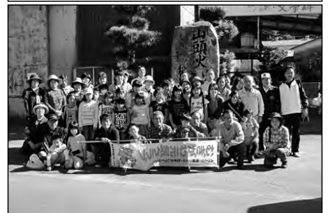
美祢市立麦川小学校

保護者や、地域の方と一緒にバスハイキングに出かけ、科学博物館の見学やミカン狩り等を行い、見聞を広めた。