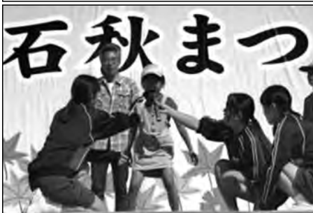
周南市立岐陽中学校

竹の子掘りや餅つき、地区運動会、子育て体験、うどんづくり、地区秋まつりなど、校区内の公民館からさまざまなボランティアの要請があり、毎回多くの生徒が参加している。