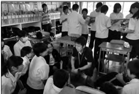
下関市立向井小学校・彦島中学校

小学校の教員が中学生にA F P Yの指導をし、人間関係づくりのためのアクティビティを行った。