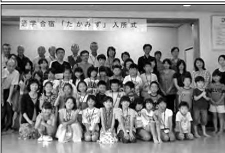
周南市立高水小学校・家庭・地域

学校・家庭・地域が連携し4年生による4泊5日の通学合宿を行った。24名の児童は仲間との共同生活で友情を深めた。