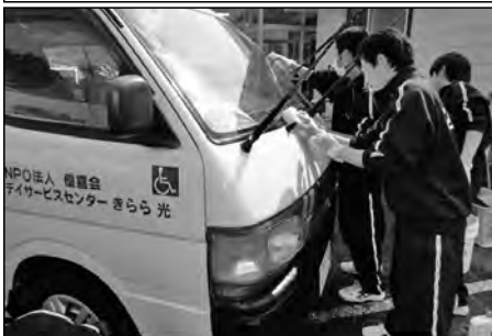
光市立島田中学校

3月下旬の平日の午後、全校生徒が地域各所に出向き、「ピカピカデイ」という名のボランティア活動を行っている。