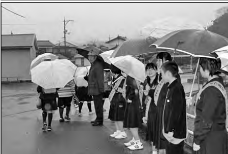
美祢市立伊佐小学校・伊佐中学校

昨年度から、小中合同運動会準備委員会を立ち上げ、プログラムの内容等を中心に検討を重ね、9月12日(土)に第1回豊田前小中合同運動会を、保護者をはじめ地域の方々にも多数来校していただき実施した。