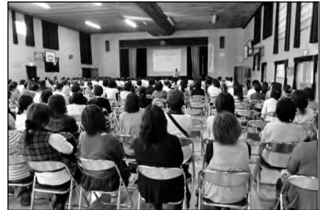
岩国市立灘小学校

学校の教育講演会を地域の方々の学習の場として開放し、児童、保護者、地域の方が共に学習する講演会を実施した。