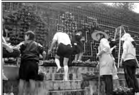
萩市立福栄中学校

11月に「公開講座」を開催し、学校を「大人の学びの場」としている。当日は、11講座を開講し、216名の保護者や地域の方が参加された。