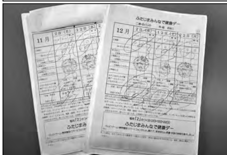
山口市立二島小学校・二島中学校 二島幼稚園

毎月「2」のつく日を「ふたじまみんなで健康デー」として、学校・家庭・地域が協力して、ノーマディアに取り組み、家庭団らん・読書・学習の時間を増やすように努めている。