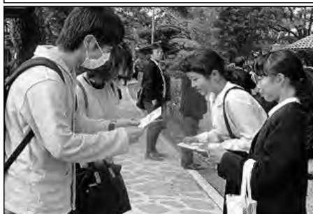
萩市立椿東小学校

地域の世界遺産について、萩市世界文化遺産課や観光課等と連携し、現地学習等で学んだことをパンフレットにし、松陰神社にて観光客へ説明をしながら配付した。