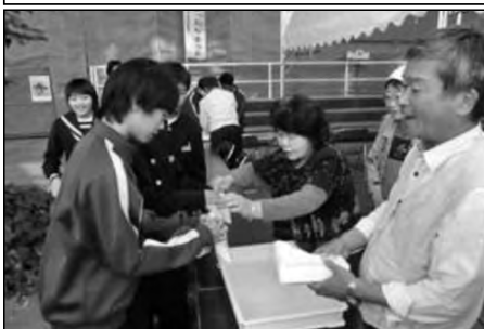
岩国市立川下中学校・川下小学校 地域

児童、生徒、地域住民約600名が参加した防災訓練(煙霧、給水、炊き出し体験等)を実施した。