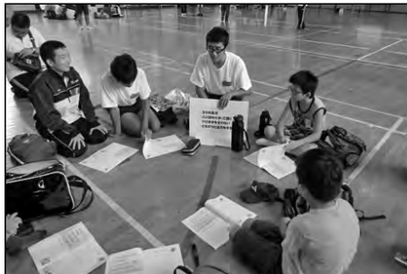
防府市立新田小学校・華陽中学校

地域ぐるみ防災キャンプを8月29・30日に本校生徒と新田小学校生徒54名で消防署や自衛隊の協力のもと実施した。