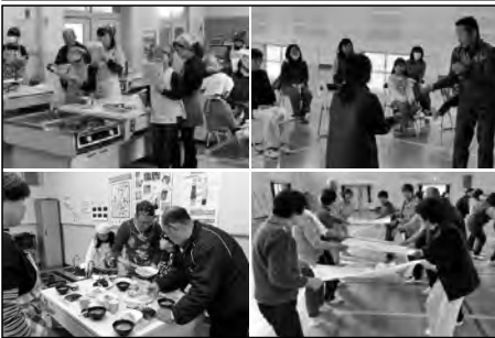
山口市立興進小学校

興進小学校の教育施設を使って、地域への生涯学習講座を開催し、学校への理解と支援を広げている。