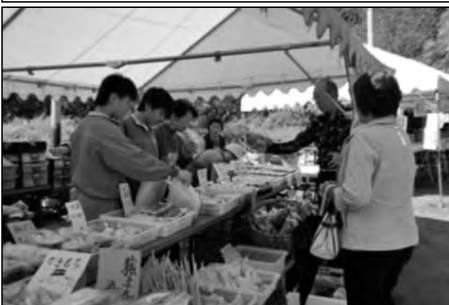
長門市立俵山中学校

俵山シャクナゲ園でゴールデンウィーク中に地域の方が行っている特産品等の販売を、毎年、生徒がボランティアとして手伝っている。接客など職場体験学習にも役立っている。