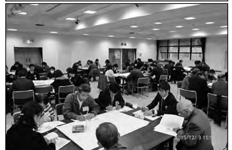
下関市立室津小学校・誠意小学校 豊洋中学校

小中の教職員、保護者、学校運営協議会委員により「小中学校で育てたい子ども像」をテーマとして熟議を行った。