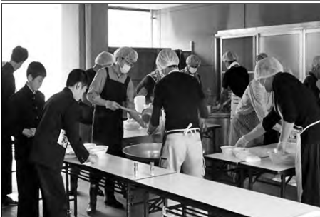
田布施町立田布施中学校 おやじの会

コミスク委員、教職員、保護者、地域住民による熟議を行い、上関で育てたい子どもの姿を共有した。