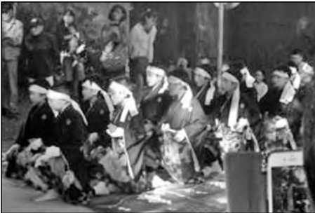
萩市立白水小学校

地域の伝統行事である「天狗拍子」に3年生以上の児童18名が参加し、地域の方から称賛された。