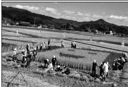
田布施町立田布施西小学校