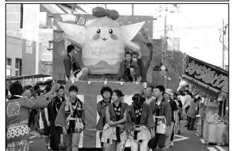
宇部市立西岐波中学校

生徒会執行部を中心とした子どもたちが製作したマスコット(KIWAリン)を山車に乗せ、地域の祭りに参加した。