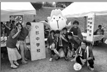
山口市立小郡中学校

「ふしの夏祭り」において、ボランティア生徒が保護者、教職員とともにブースを出し、かき氷等の販売を行った。