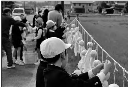
柳井市立柳井南小学校

「いほのしょう春まつり」の当日の晴天と、まつりの成功を祈願して会場前の田んぼに「てるてる坊主」を取り付けた。