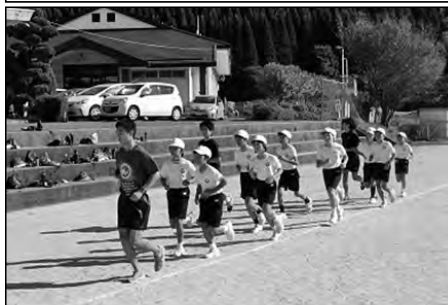
光市立上島田小学校・島田中学校

5・6年生が、島田中の陸上部員と中学校の先生から陸上記録会に向けての指導をしていただいた。