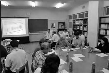
周防大島町立大島中学校

大島地区小中合同運営協議会を開催した。各小中学校の体験活動の取組を紹介した後に、熟議を行った。