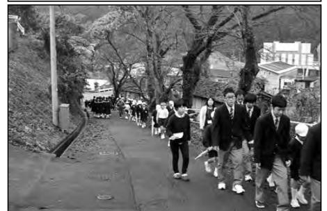
岩国市立錦清流小学校・錦中学校 岩国高等学校広瀬分校

小・中・高校が連携した避難訓練を実施し、避難指示発令で、小学生を高校生が誘導しながら、二次避難場所の錦中学校へ誘導した。