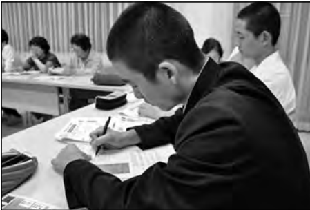
山口市立大殿中学校

大殿地域協育ネットにより大殿ふるさとまつり実行委員会に生徒会の代表が実行委員として参画した。