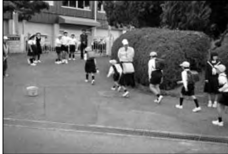
周南市立勝間小学校・熊毛中学校

毎月15日は、中学校の生徒と小学校の生活委員会の児童が、挨拶運動を実施した。顔見知りの中学生が率先してあいさつをすることで、児童も今まで以上にあいさつへの意識が高まった。