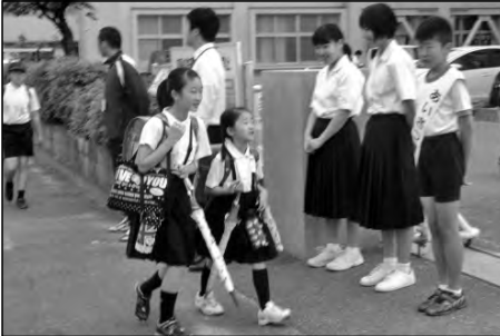
岩国市立麻里布小学校 麻里布中学校

小学校の児童と中学校の生徒会が連携して、朝のあいさつ運動を子どもたちや地域の方に行っている。