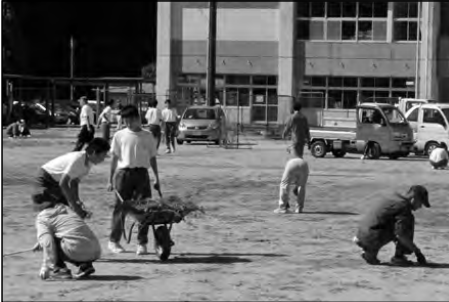
周南市立和田小学校・和田中学校 地域

小中学校、保護者、地域の方で除草や樹木のせん定など、校内の環境整備活動を行った。