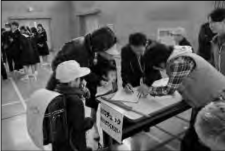
山口市立仁保小学校・仁保中学校 仁保幼稚園

12月に幼保小中合同引渡し訓練を実施した。初めての取組であったが、連携して無事終えることができた。