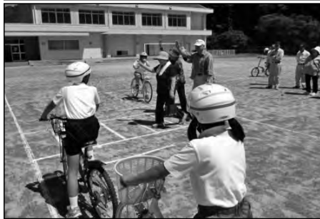
山口市立串小学校

地域のお年寄りと一緒に交通安全教室を開催し、お互いに交通安全の意識を高めることができた。