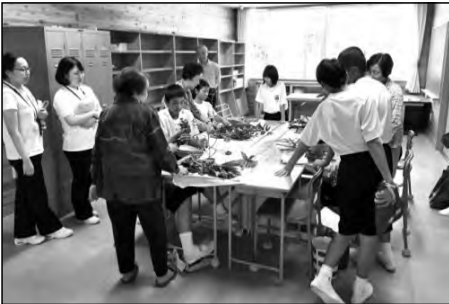
和木町立和木中学校

生け花を学ぶサークルが、月に1回中学校で活動している。生徒が見学に来た際には体験もさせてもらい、生けた花を玄関に展示してもらった。