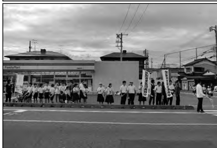
下関市立安岡小学校・安岡中学校

小・中の児童生徒や保護者等が学校近くの路上で、地域の方にあいさつをしながら交通安全を呼びかけた。