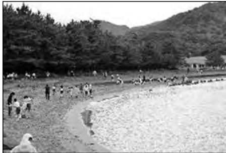
萩市立大井小学校・大井中学校

大井小中の児童生徒・保護者・地域の方の三者が協力し合って、大浜海岸の清掃活動を行った。参加人数も多く、砂浜もきれいになり、協力することの大切さを知る体験となった。