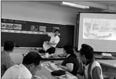
山陽小野田市立高千帆小学校

ボランティア活動を積極的に推進するために「ハッピー桃太郎プロジェクト」を立ち上げた。生徒にマスコットキャラクターを募集し、のぼり旗やステッカーを作成し、活動の場面を盛り上げた。