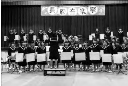
下関市立豊浦小学校・長府中学校 長府高等学校・豊浦高等学校

地域団体の記念行事として、豊浦小・長府中・長府高・豊浦高が協力し、児童・生徒が出演する音楽祭が開催された。