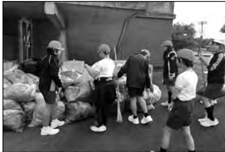
光市立大和中学校区

今年度初となる大和中校区合同の持久走大会を公民館主催で行い、大会後小中学校が連携して地域の清掃活動を行った。