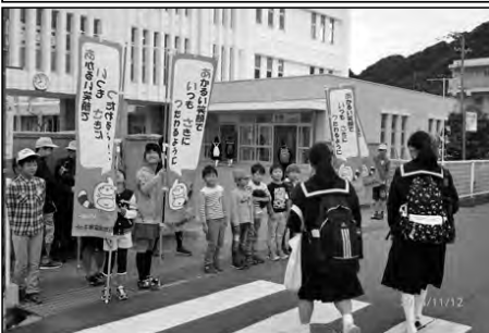
山口市立白石小学校・白石中学校

あいさつ運動キャラクター「しらっぴー」がデザインされたのぼり旗を使って、小・中学校であいさつ運動を行った。