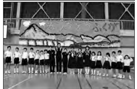
阿武町立福賀小学校・福賀中学校

地域への感謝の気持ちをこめた学校祭を小・中合同で実施した。本年度末で閉校になる福賀中との最後の学校祭となった。