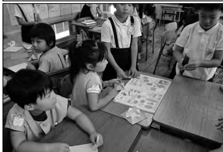
山口市立湯田小学校・湯田幼稚園 楠木保育園・山口保育園

校区内の幼稚園、保育園の年長児が来校し、2年生と交流を行ったり、給食を試食したりした。