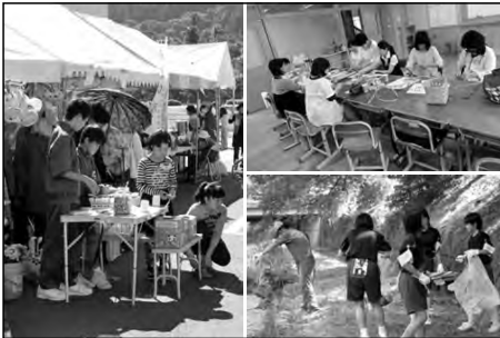
美祢市立大嶺中学校

「みね桜まつり」や「福祉の市」等にボランティアとして協力している。また、空き教室を「コミュニティルーム」として常時開放したり、部活動単位で校区内の清掃活動に参加したりしている。