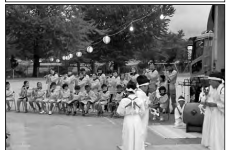
美祢市立別府小学校

地域の伝統芸能「別府岩戸神楽舞」を3年生以上が学んでいる。地域の盆踊りや神社の大祭で披露し、伝統を継承する姿を見せている。