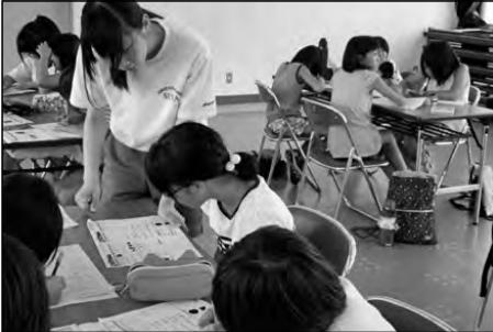
萩市立育英小学校・弥富小学校 須佐中学校・須佐保育園

中学生がリトルティーチャーとして育英小学校、弥富小学校で、夏休みに学習会を行った。須佐保育園でも園児と一緒に活動した。