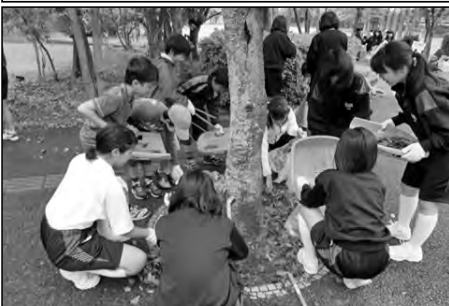
山口市立白石小学校・白石中学校

今年度は小中合同ボランティア清掃を3回行った。保護者の方の参加も多数あり、パークロードの清掃を楽しく行うことができた。