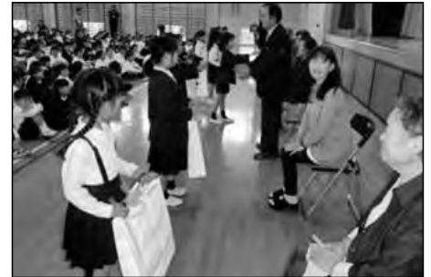
下関市立山の田小学校

授業への支援や見守り活動をされている「にじいろネット応援団」の皆さんを招待して、感謝のつどいを行った。