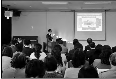
宇部市立新川小学校・小羽山小学校 桃山中学校

桃山中校区の三つの学校運営協議会が合同で研修会を企画。3校の全教職員とコミスク関係者が一堂に会し、先進校萩東中学校の校長や会長から取組について学び、研修を深めた。