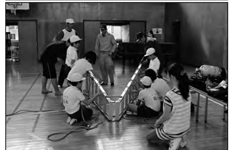
下松市立久保小学校・東陽小学校 久保中学校

台風や地震など、いざというときに役立つ知識や技能を身に付けることができる「防災キャンプ」を毎年行っている。