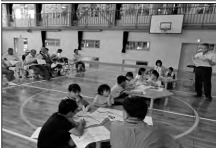
美祢市立川東小学校

敬老会にボランティアとして参加し、お年寄りの方一人ひとりに、全校生徒が作成したしおりをプレゼントした。