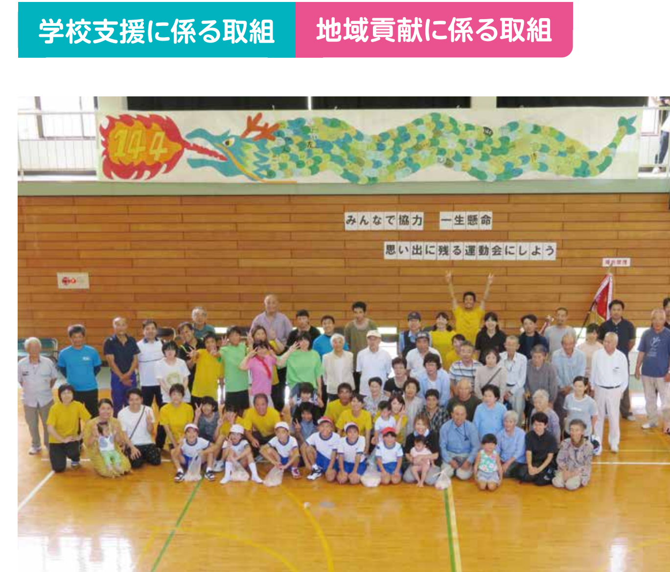
学校支援に係る取組 地域貢献に係る取組

特色ある教育の一つとして、「ふるさとガイド養成講座」を行っています。地域行事で島を訪れた人に相島の魅力を紹介することで、自分のふるさとの魅力を再発見しています。