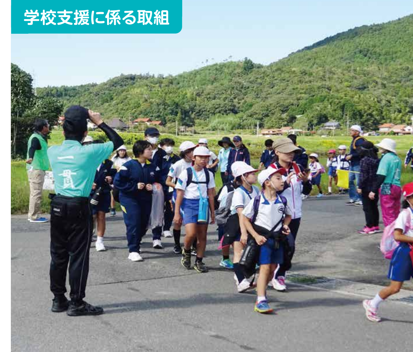
学校支援に係る取組

川上小・中学校運営協議会の協力により、地域の自然や歴史を教材とした「阿武川学習」に取り組んでいます。今年度は阿武川カヌー川下りを見事成し遂げました。