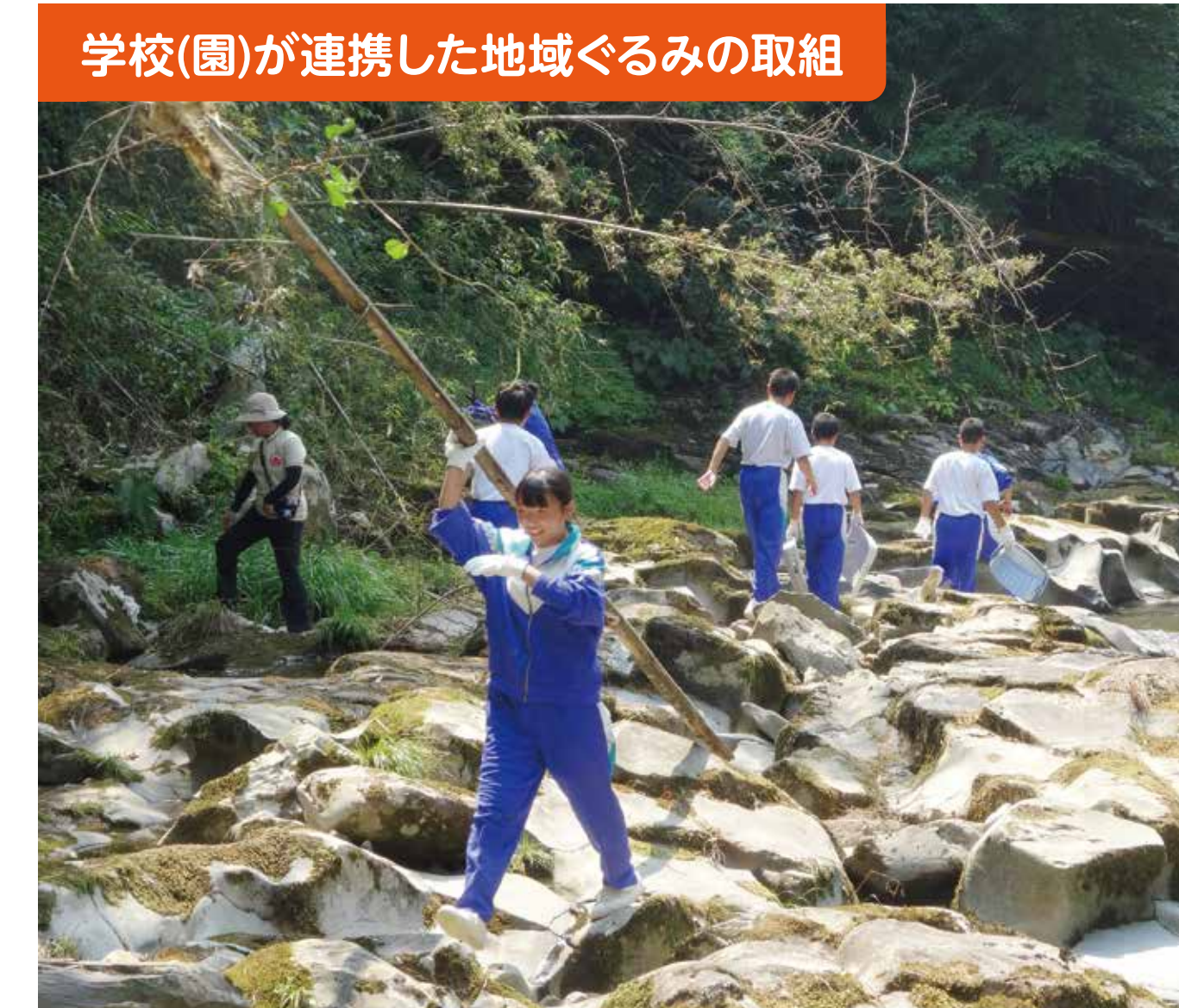
学校(園)が連携した地域ぐるみの取組

地域の方と合同で運動会を行っており、今年で3回目となりました。地域の方から大きな声援をいただき、また、地域の方にとっては交流の場にもなり喜んでいただいています。