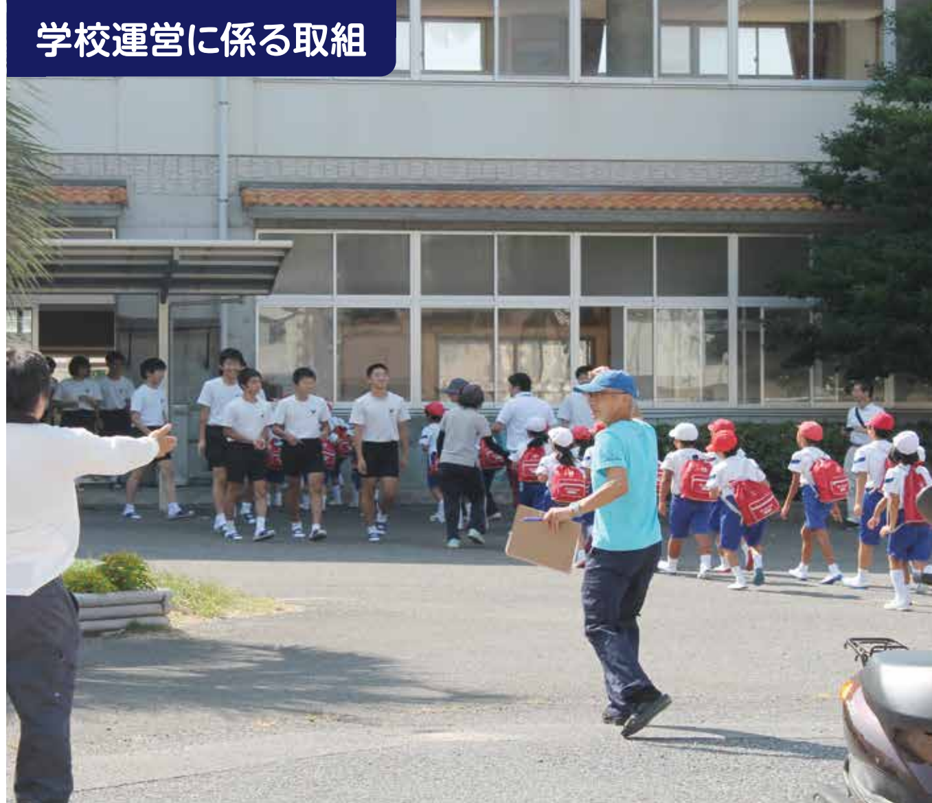
学校運営に係る取組