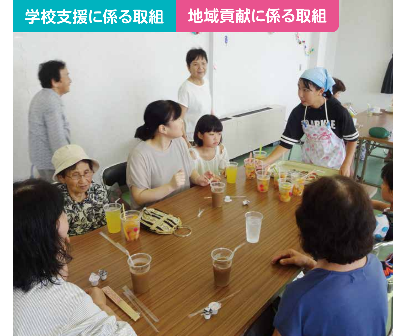
学校支援に係る取組 地域貢献に係る取組

小中一貫カリキュラムの中核的な行事として福栄地域探訪遠足を実施しています。保護者・地域の方には、交通安全の確保や帰校してからのかき氷の準備などにご協力いただいています。