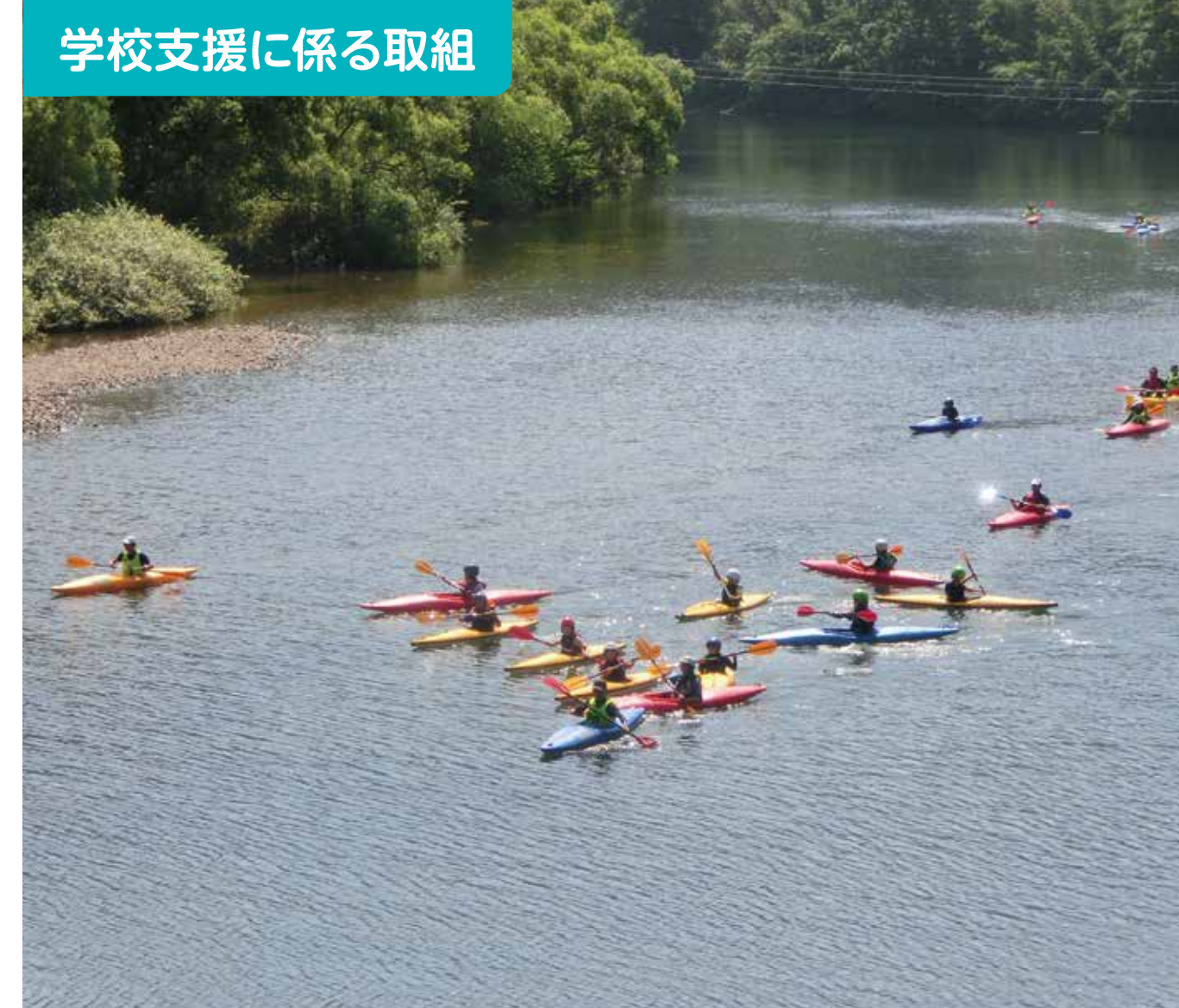
学校支援に係る取組

「共助の取組で、地域の絆を深めたい」という、かざまネット協議会の提案で実現した小・中・地域合同の地域防災訓練も今年で2回目。昨年度の振り返りを生かして、より充実した取組ができました。