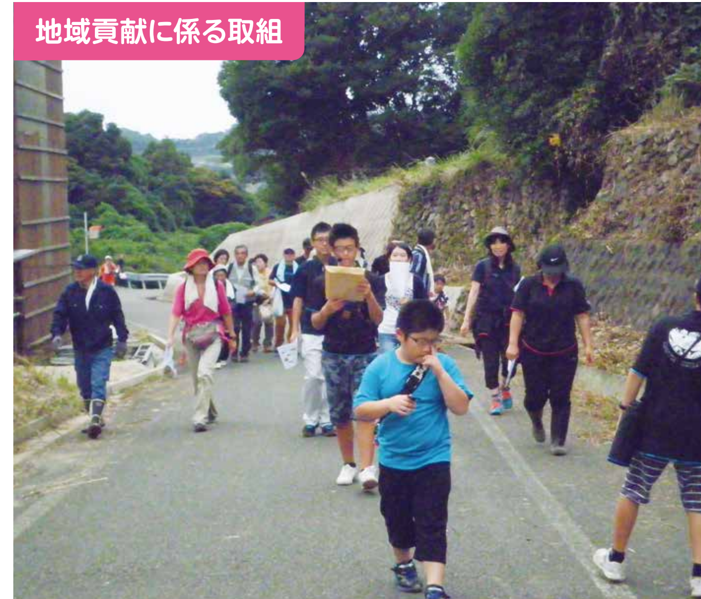
地域貢献に係る取組

学校運営協議会の協力の下、「ふるさと学習」に取り組んでいます。今年は、見島味噌づくりとその販売を通して地域のPRにも貢献しました。