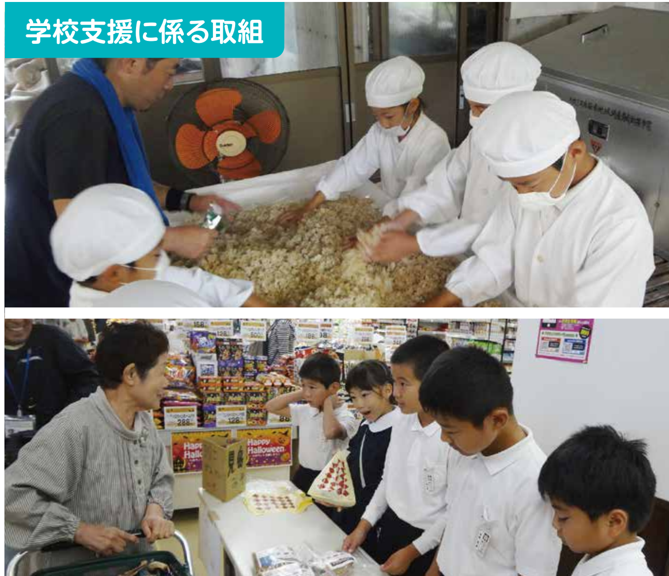
学校支援に係る取組

学校運営協議会の協力のもと、大島の未来を創る人材を育てることをめざした「秋大島ふるさと創造科」の取組として、「島を魅力化する活動」を行っています。