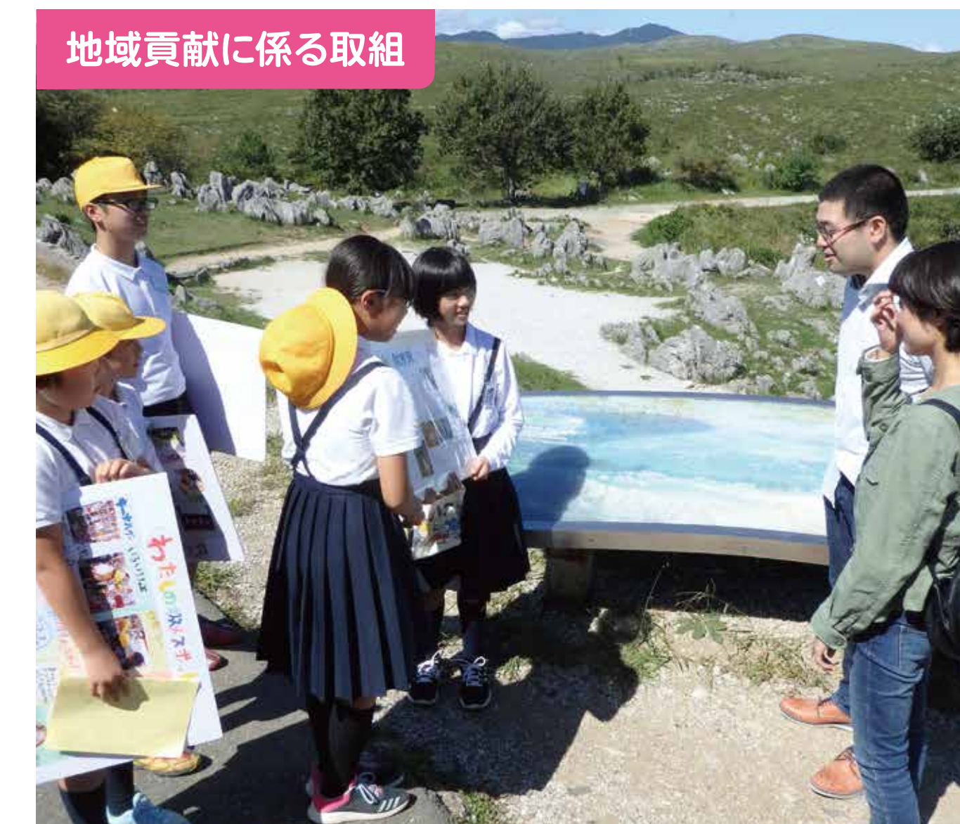
地域貢献に係る取組

【花育】 毎月1回生徒がボランティアで校内に置く花を生ける活動で「花ボラ」と呼ばれています。保護者や地域の方々にも参加していただいています。