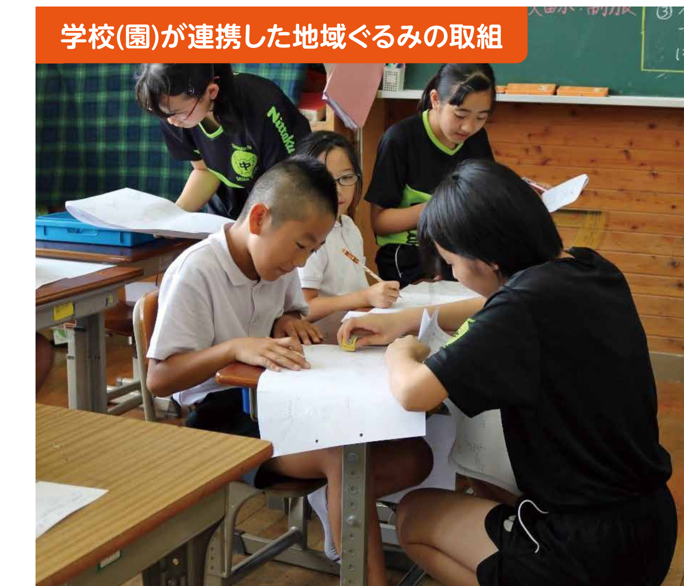
学校(園)が連携した地域ぐるみの取組

【ふるさと子どもガイド】 総合的な学習の時間に学んだ秋吉の魅力を紹介する「ふるさと子どもガイド」。今年も、お礼のお手紙が陸前高田市などからたくさん届きました。