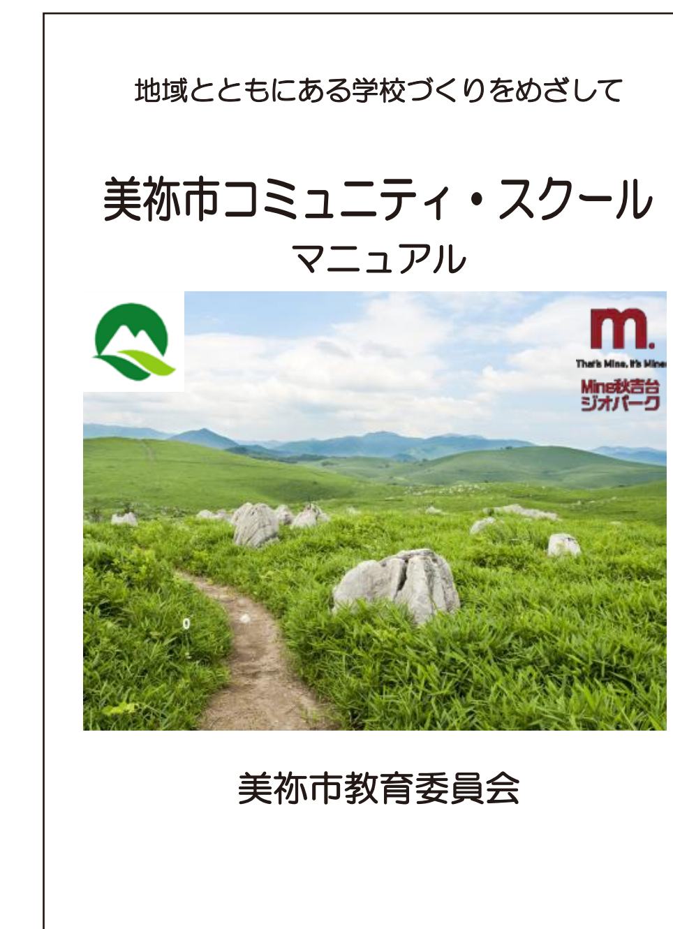
美祢市コミュニティ・スクールマニュアル作成