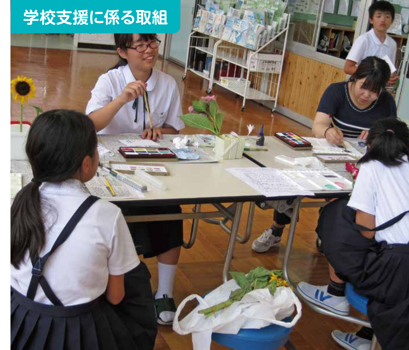
学校支援に係る取組

【あつまロン「大人と子どものディスカッション」】 子どもたちが保護者、教職員、地域のみなさんと、「住みたいまち、帰りたいまち厚保」をテーマに熟く語り合いました。