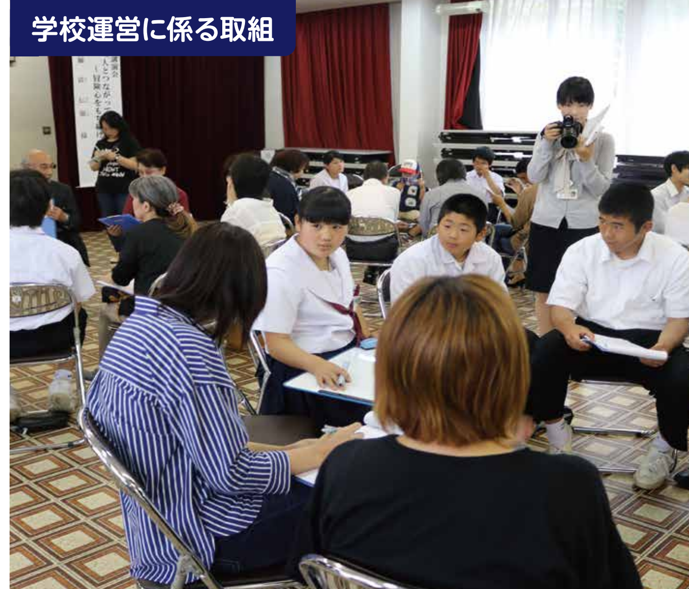
学校運営に係る取組