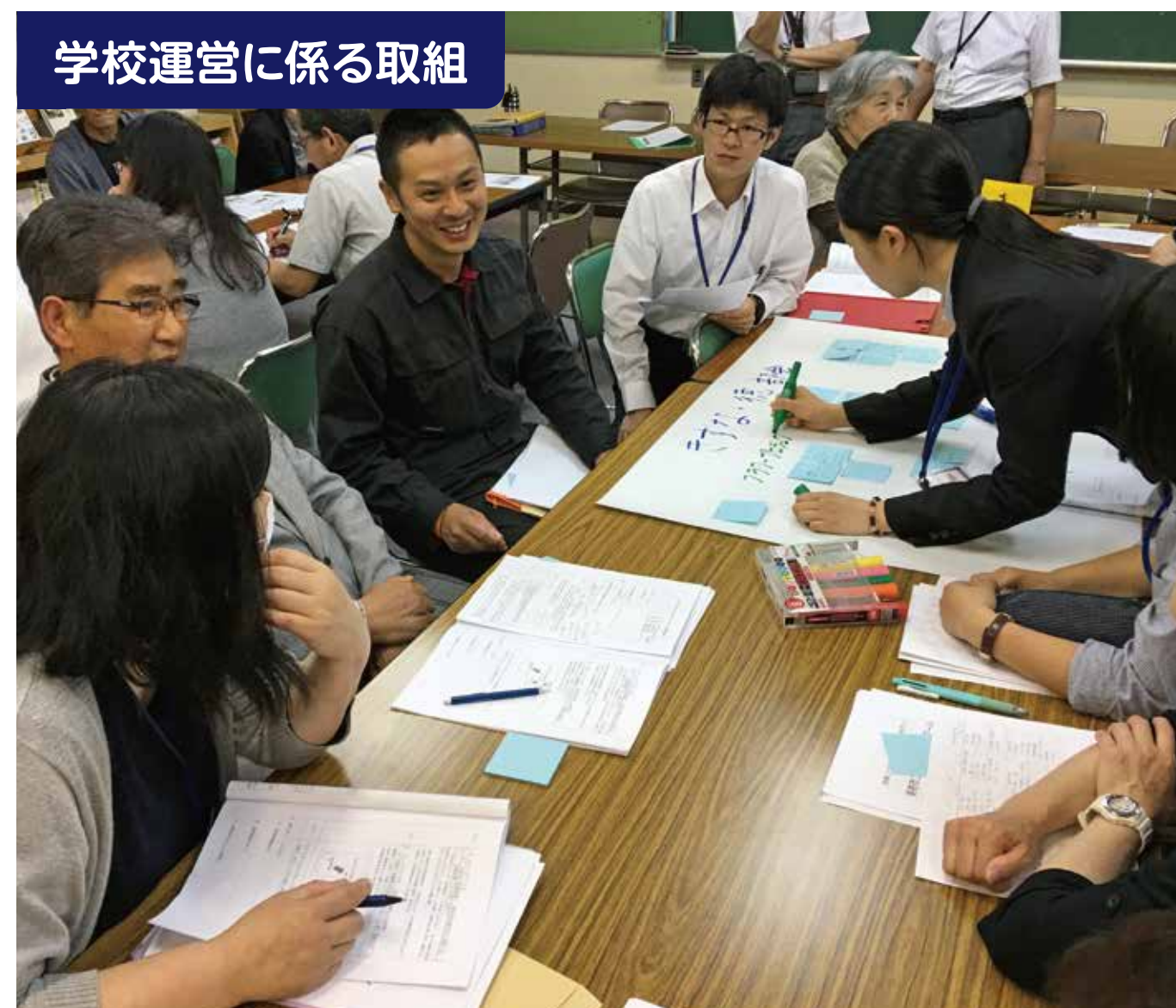
学校運営に係る取組

【おみねネットあいさつ運動】 大嶺中学校区で毎月月初めにあいさつ運動をしています。大嶺小は「あいさつ返事でつながろう」をチャレンジ目標に、学校・家庭・地域のつながりをめざしています。