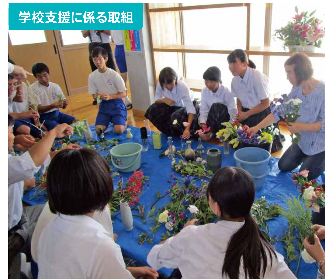
学校支援に係る取組

【熟議】 小中地域共通テーマ「ふるさと於福を愛し、夢や志を語る人を育てよう」実現にむけ、「まなび・知」「きずな・徳」「からだ・体」3部会で熟議しました。