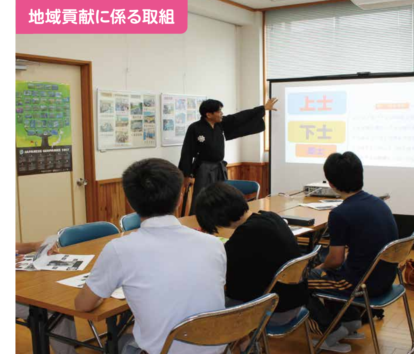
地域貢献に係る取組

【絵手紙教室】 地域の方の指導のもと、作成した絵手紙を地域の独居老人の方へ送る活動を十年以上続けています。昨年度から、小学生も一緒に活動しています。中学校閉校後も、伝統を受け継いでほしいと思います。