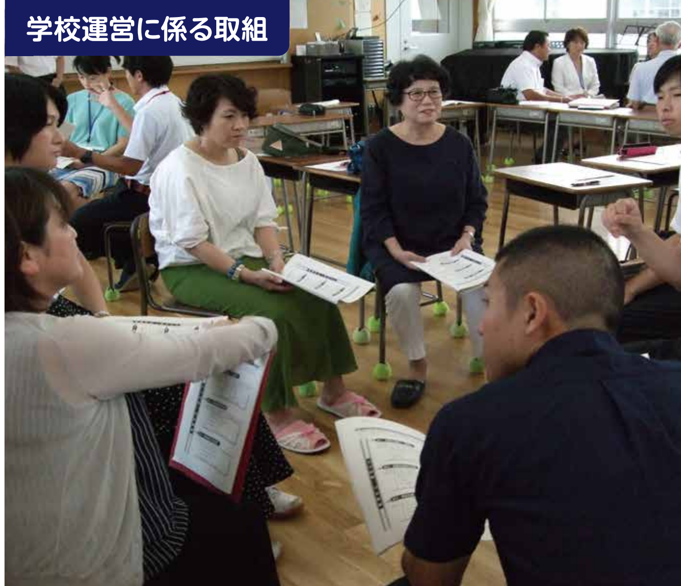
学校運営に係る取組