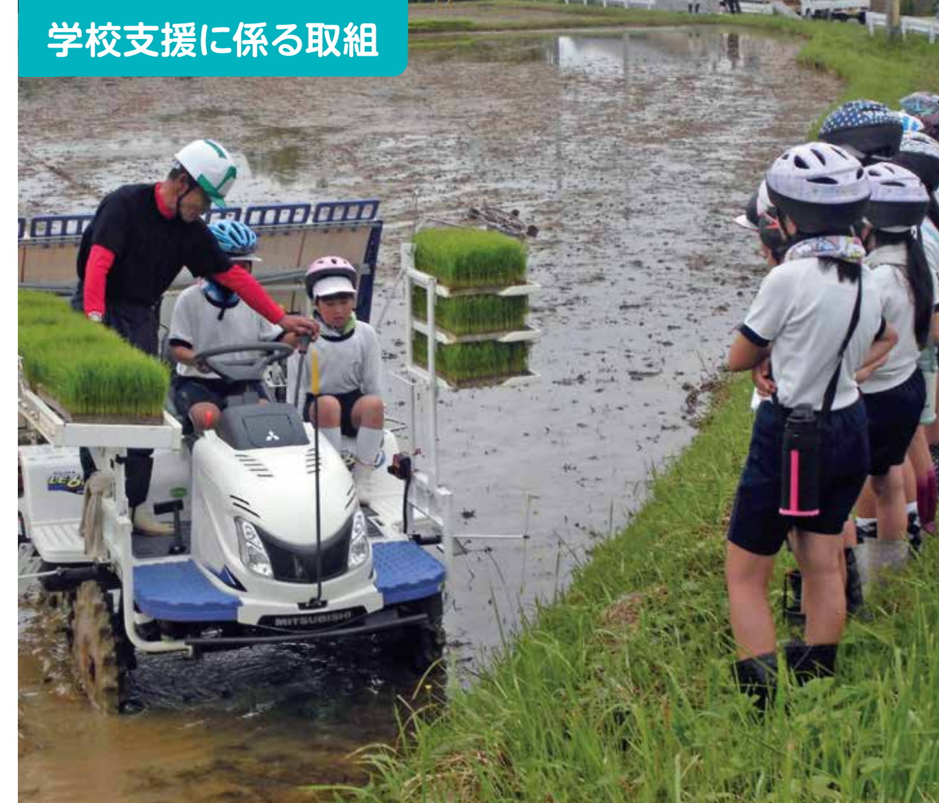
学校支援に係る取組

学校運営協議会で地域・保護者の代表の方と教職員が、教職員の働き方改革や2学期以降の学校の取組について、熟議を行った。