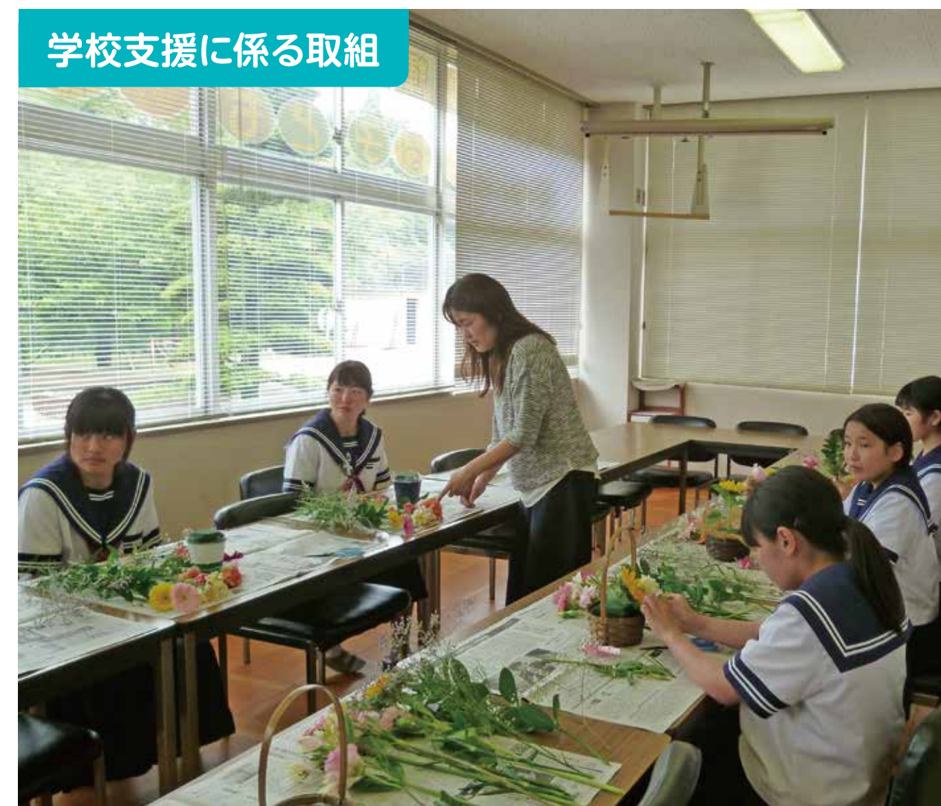
学校支援に係る取組

幼・小・中・保護者・地域の方が30名余集まり仁保協育ネットの「熟議」を開催した。15年間を見通して、どのような「仁保っ子」を育てていきたいかについて活発な意見がでた。