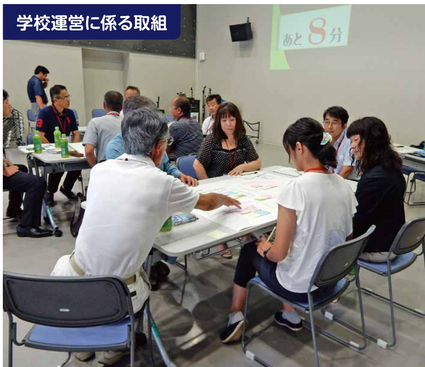
学校運営に係る取組

地域協育ネット、小中合同学校運営協議会が主催する「まちづくりセミナー」(交通安全教室)を実施した。130名以上の生徒や教職員、地域住民などが参加した。体験活動を通してのセミナーは、世代を超えた交流の場となった。