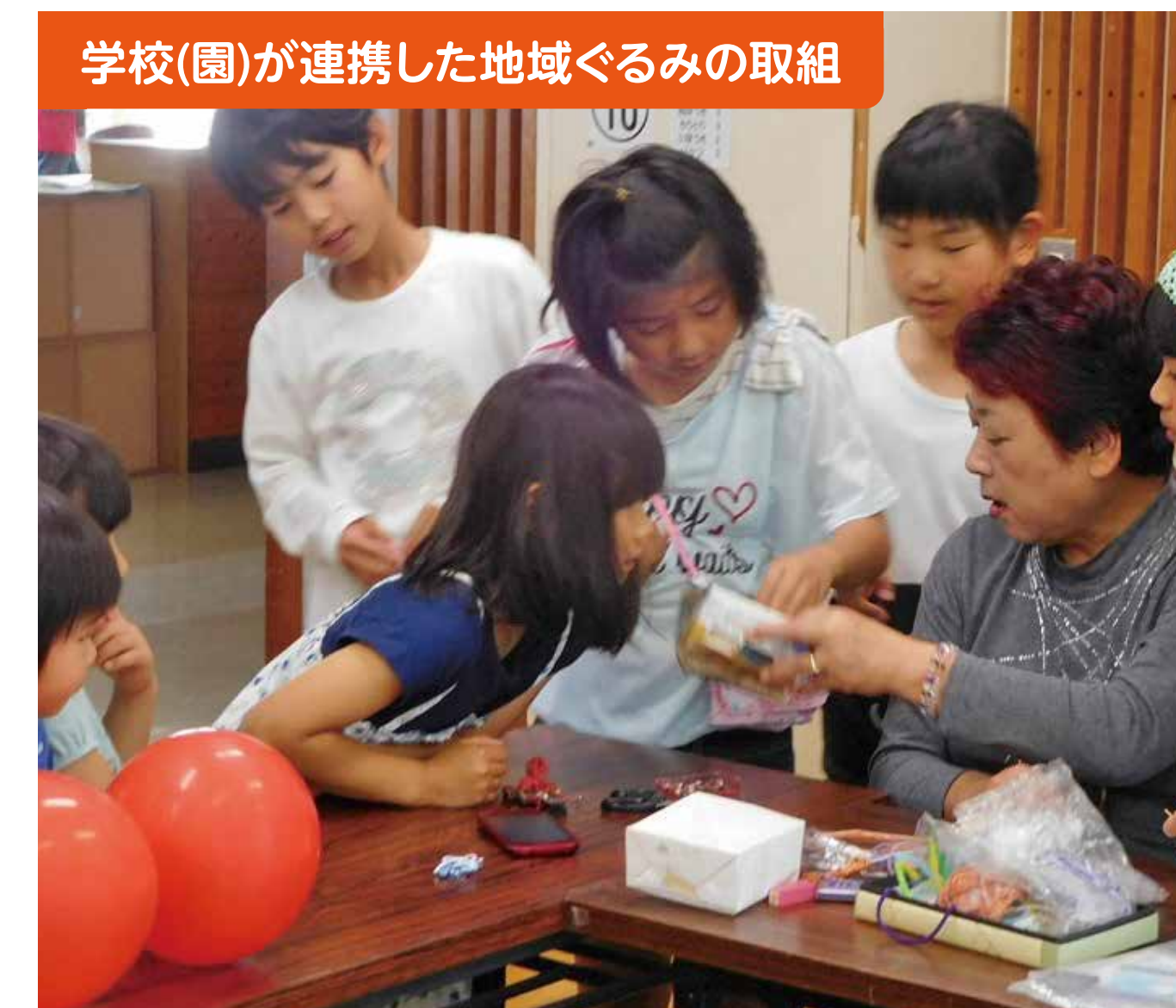
学校(園)が連携した地域ぐるみの取組

新山口夢フェスタに参加し、多くの人と出会うことができた。このボランティア活動を通して、生徒には地域の一員としての自覚が芽生え、地域の活性化に役立ちたいという心情が高まった。