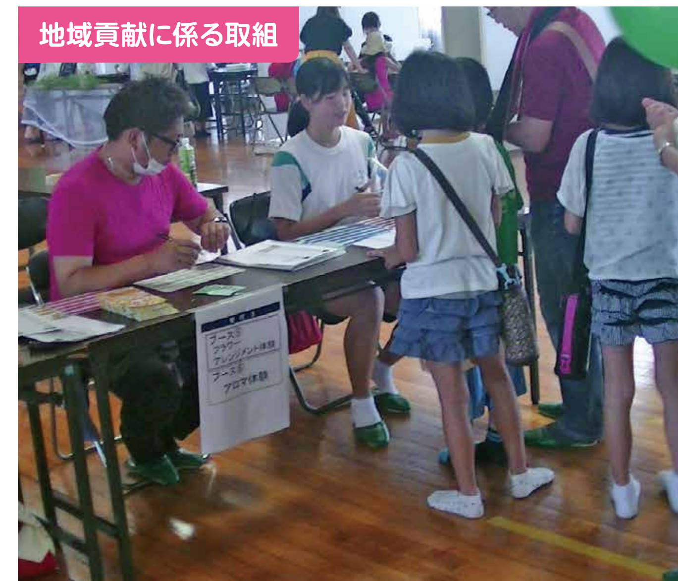
地域貢献に係る取組

地域の方を講師に迎え、希望生徒対象のフラワーアレンジメント講座を実施した。作品は各教室に飾り、校内環境美化につなげている。