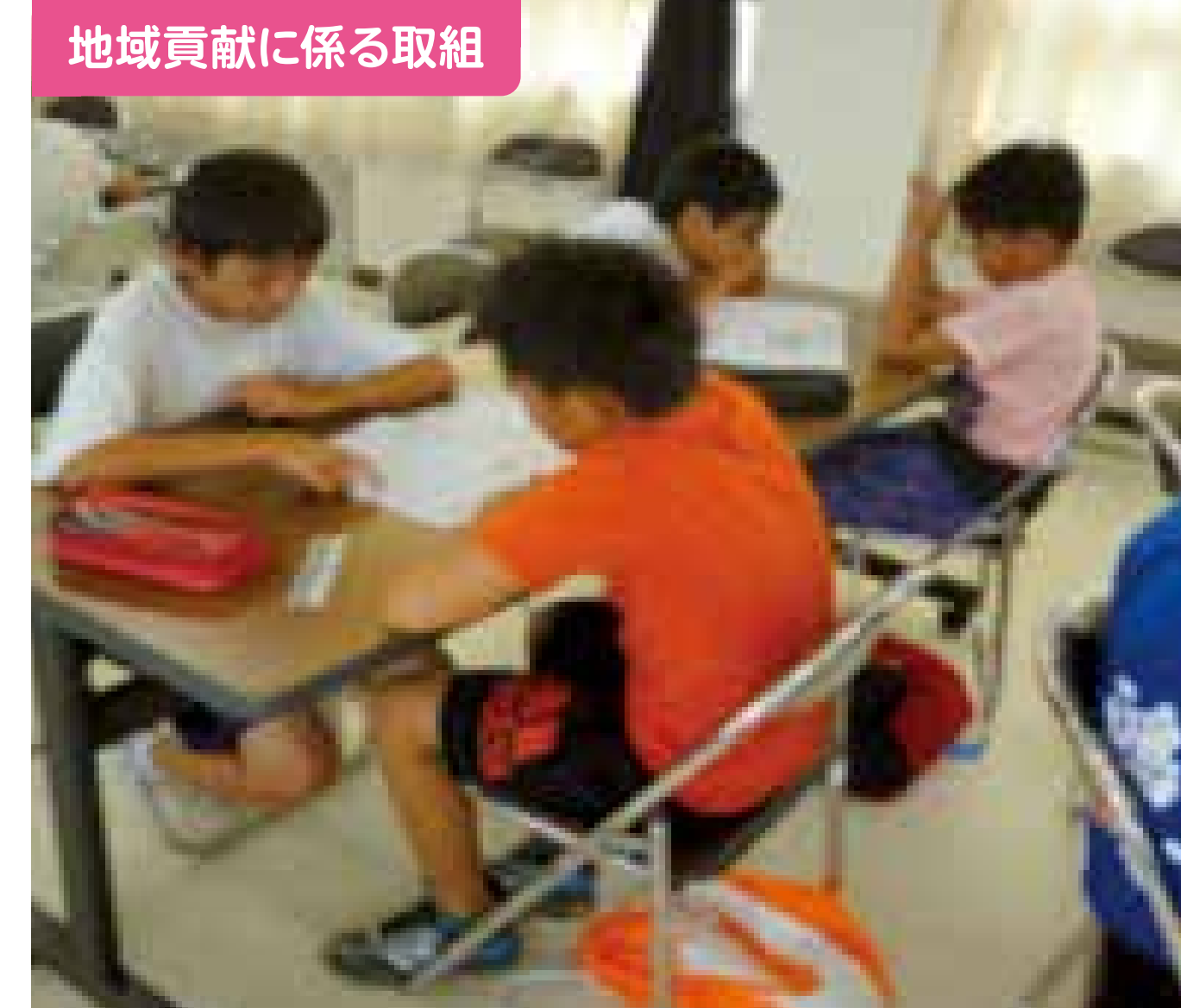
地域貢献に係る取組