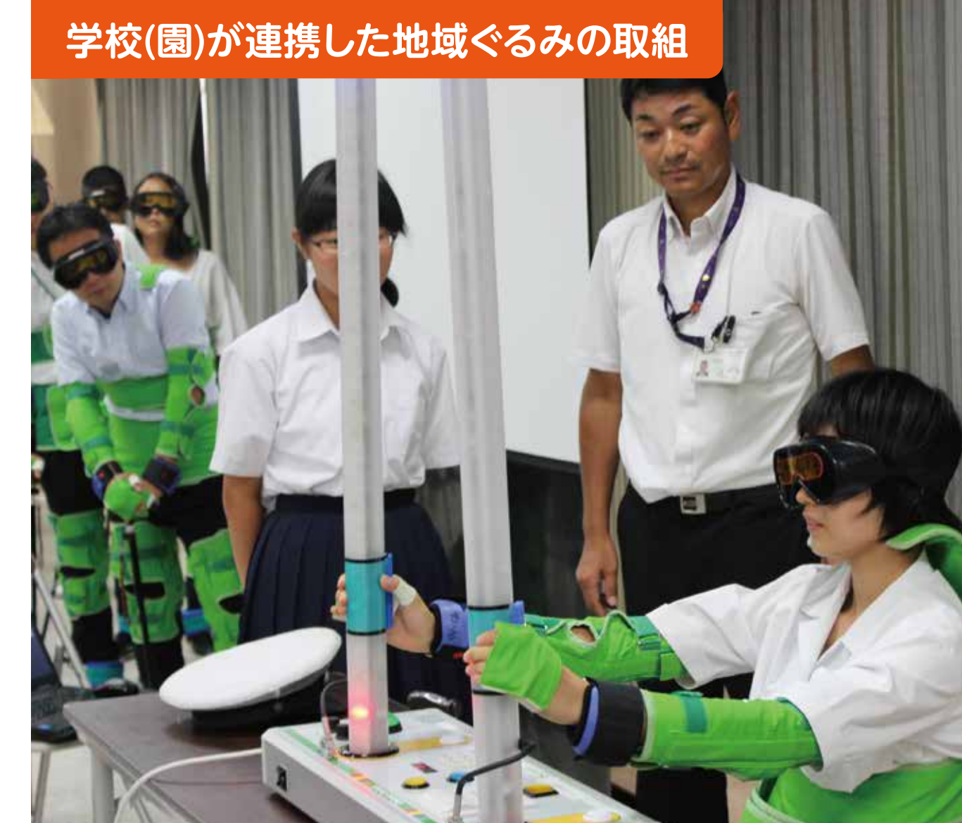
学校(園)が連携した地域ぐるみの取組

夏休み、「YKB会(吉敷交流勉強会)」、「OKB会(大蔵交流勉強会)」を実施した。小学校4・5年生を対象とし、中学生や地域の方、大学生のボランティアが「先生」となり夏休みの宿題などの個別指導を行った。和やかな雰囲気の中で、小学生との交流を深めることができた。