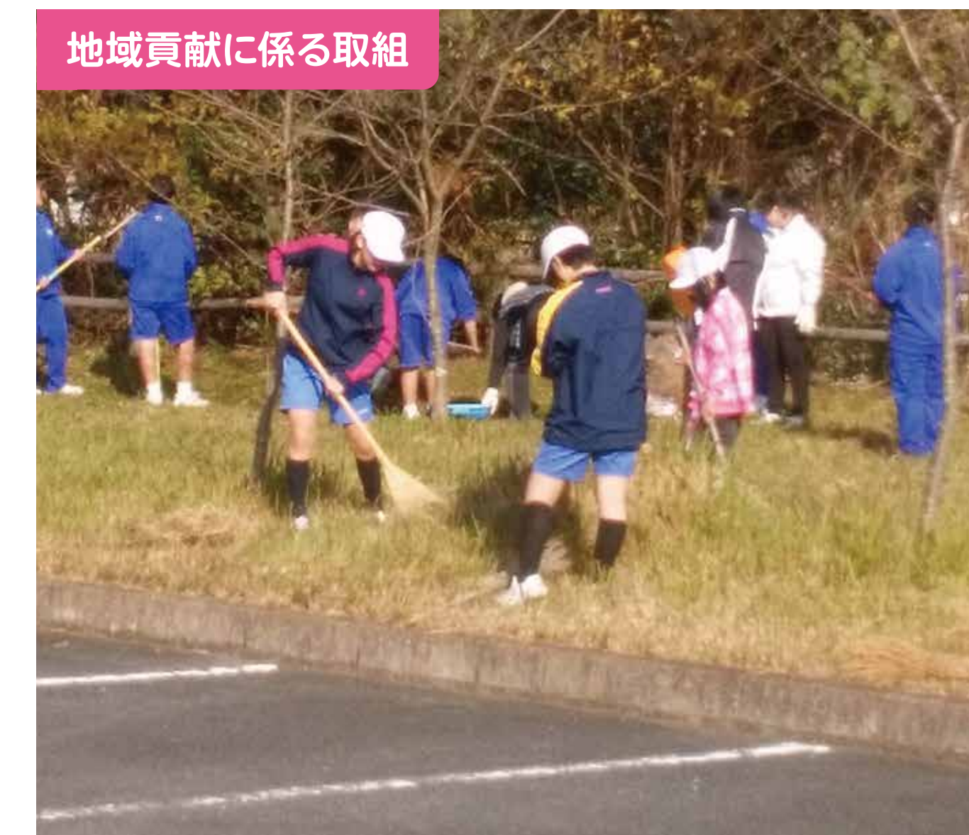
地域貢献に係る取組

平成28年度から、生徒会の参画が本格的にスタートしました。生徒が各種会議の企画等に参加することで、生徒の思いが反映された、充実した活動へと進化しています。