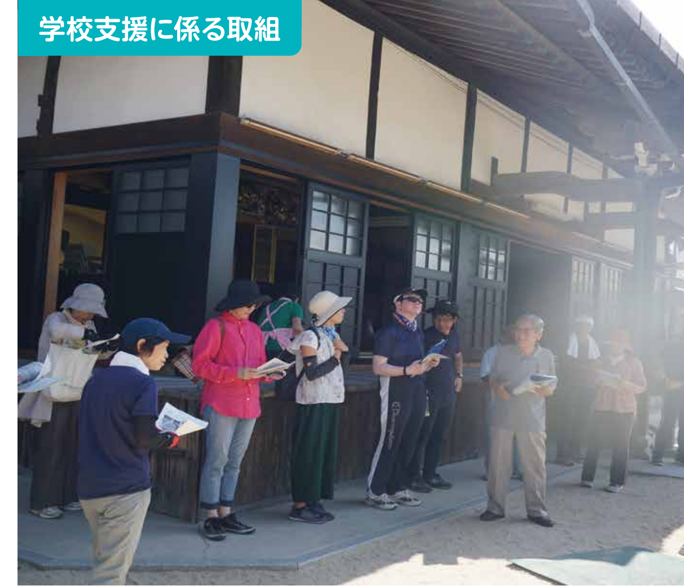
学校支援に係る取組

学校運営協議会委員を中心に、「そばづくり」と「ものづくり」のプロジェクトを実施しました。児童・保護者・地域の方で楽しく活動し交流が深まりました。