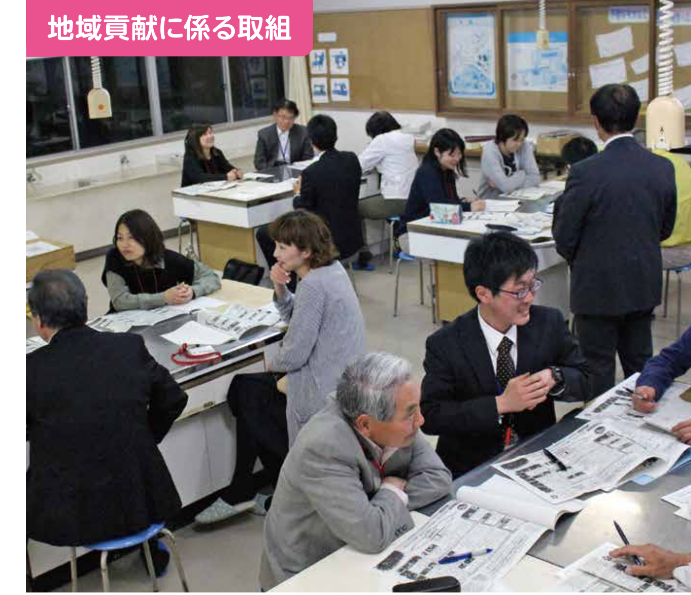
地域貢献に係る取組

「まずは、大人が地域を知ろう」と、夏休みに、小・中の学校運営協議会委員及び教職員、PTA代表総勢57名でフィールドワークを行い、地域の良さを再認識しました。