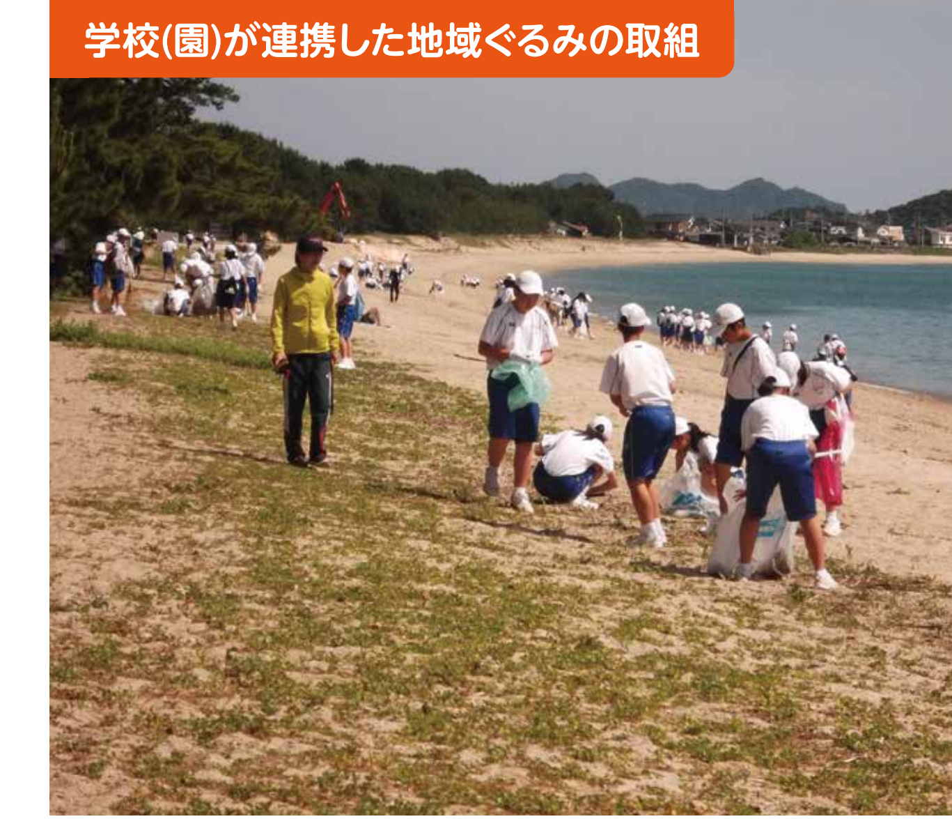
学校(園)が連携した地域ぐるみの取組

今年度の第1回学校運営協議会では、「重点目標の達成に向けた方策」について、地域・学校・PTAの計44名が9グループに分かれて熱心な協議を行いました。