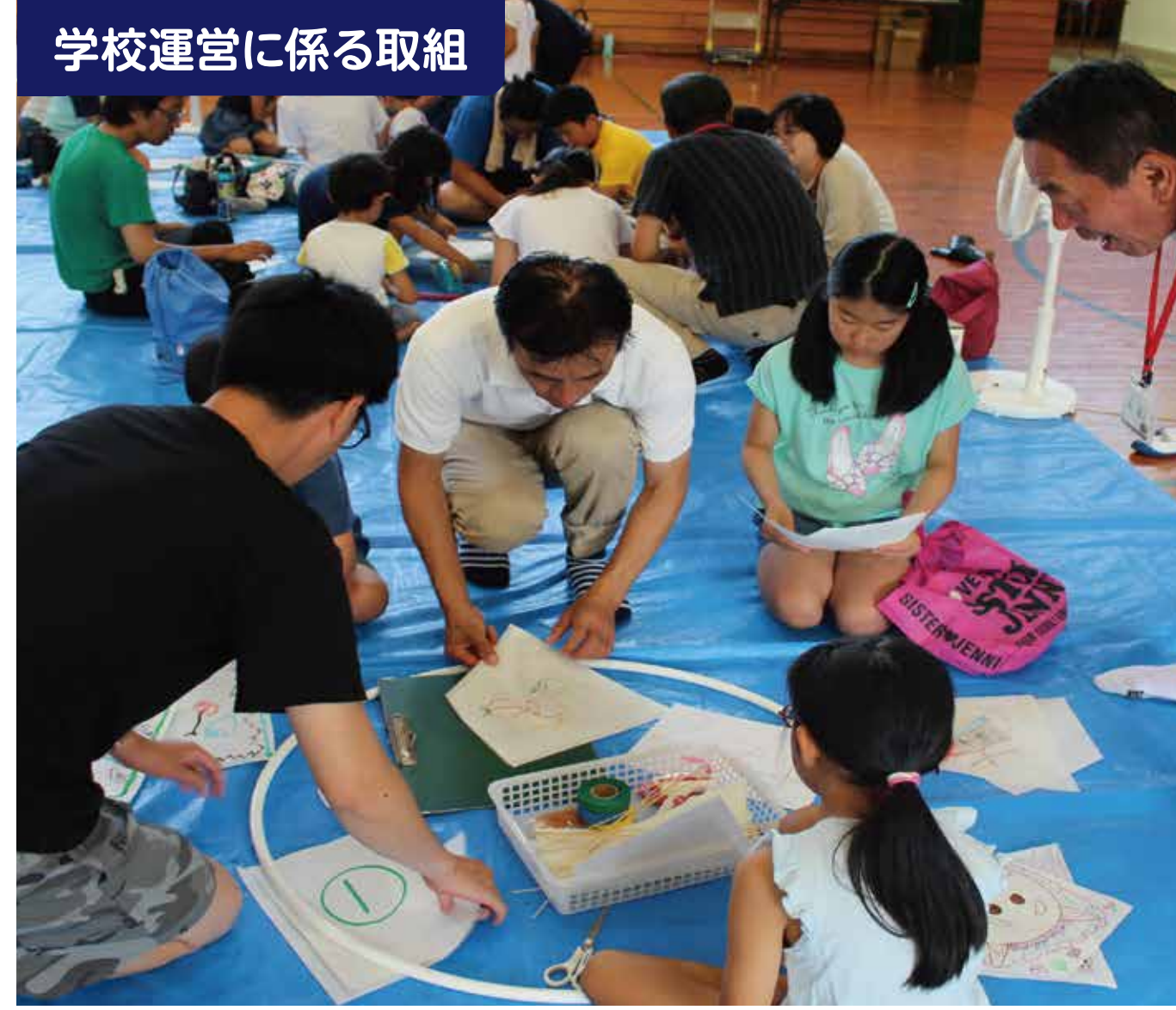
学校運営に係る取組