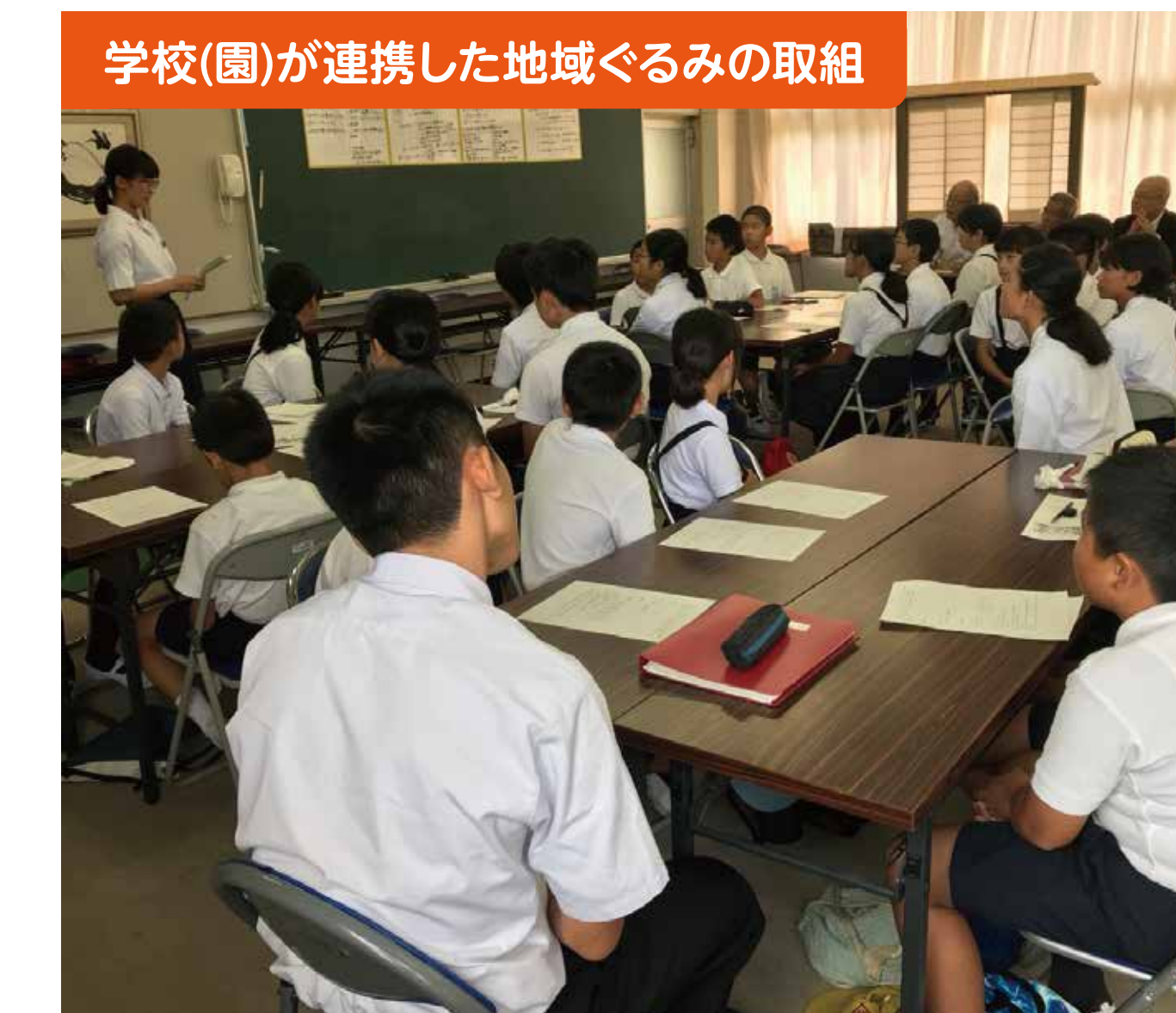
学校(園)が連携した地域ぐるみの取組

大和地域小中学校ロードレース大会実施後、各小学校5・6年生、中学生、保護者の方々により、会場の大和総合運動公園・伊藤公資料館の清掃活動に取り組んでいます。