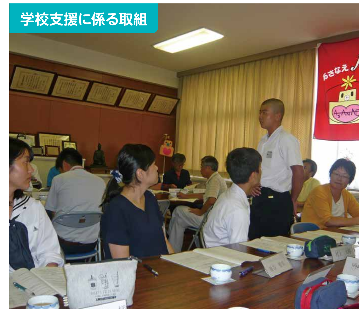
学校支援に係る取組

保護者ボランティアにより、プリント等の印刷を行っていただいています。これにより教員は児童に寄り添う時間が増え、子どもとの信頼関係の醸成に大いに役立っています。