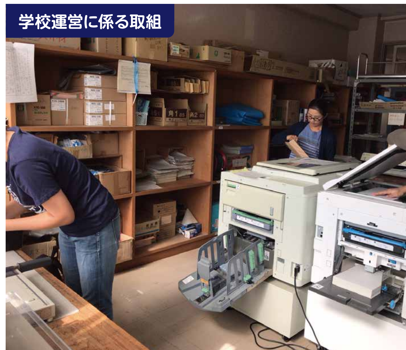
学校運営に係る取組

「室中絆宣言」に「支えてくださる人々に感謝し、地域の担い手として誇りをもちます。」の一文があります。海岸清掃などの地域貢献活動に熱心に取り組んでいます。