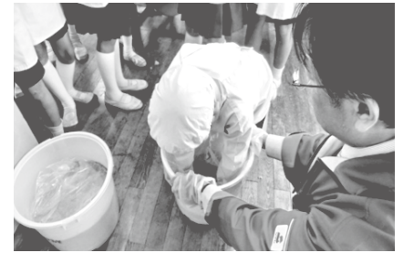
総合的な学習の時間における味噌の仕込み作業の体験