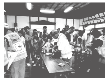
防災訓練ワークショップ

今年度は、災害の形態に合わせて避難指示の連絡を受け、自宅から指定された場所に避難するという訓練内容でした。自治会ごとに想定される災害に合わせて訓練し、教員も避難場所に待機するなど、学校をあげて訓練に参加しました。