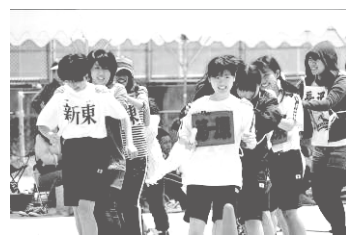
原校区コミュニティ運動会

原小学校区でのコミュニティ運動会に、中学校の生徒が参加しました。5月に実施された運動会では、好天に負けないほどの活躍をしました。競技に参加するだけでなく、招集、賞品、道具、バザー係の役割の生徒がそれぞれ一生懸命に活動しました。この運動会に参加した生徒の表情や活動からは、はにかみながらも競い合いに夢中になるのが分かりました。この様子から、生徒は地域に生き、また、地域に支えられながら育てられていると感じました。