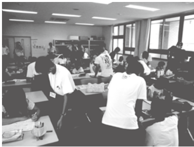
「YKB会（吉敷交流勉強会）」の取組 (鴻南中・良城小)

「YKB会（吉敷交流勉強会）」は、夏休みに、夏休み帳などの宿題を行う小学生の学習会に中学生や地域の方が学習ボランティアとして参加するという取組です。児童は中学生や地域の方との勉強会をととても喜んでおり、冬休みには第2回目のYKB会を実施しました。