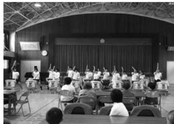
「豊生苑」での交流会