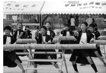
地域との合同運動会