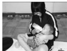
思春期子育て体験

技術・家庭科の学習で、中学生が赤ちゃんとおふれあう体験を行っています。実際に赤ちゃんの世話をしたり、親から話を聞いたりして、子育て中の親子とかかわりをもつことで自分自身の親子関係を見直し、命の大切さや将来の子育てをイメージするとともに、地域との新たなつながりをつくることを目的としています。