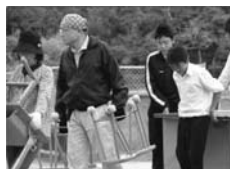
新校舎への引越し

新校舎移転に伴う引越し作業には、呼びかけに応じてくださった地域の方やPTA会員とともに秋穂中学校の生徒もボランティアとして参加しました。小学生は、「学校は地域でとても大切にされていること」を感じながら、翌日から新校舎での学校生活をスタートすることができました。