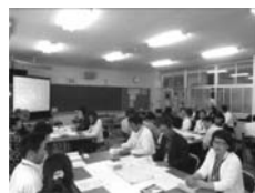
地域関係者との「熟議」

3校の学校運営協議会が合同で「熟議」を開催しました。各グループで15年間で育てたい秋穂の子ども像である「思いやりのある子」「夢につながる子」「ふるさとを愛する子」の中から一つをテーマとして選び、その「姿」に迫るために学校・家庭・地域が連携・協働できそうな取組を話し合い、全体で発表し合う活動を通して、学校間及び地域との連携を深めました。