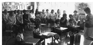
学校支援活動見学会