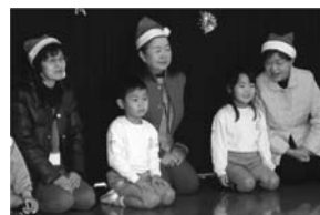
幼稚園での支援活動