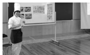
パティシエによる授業