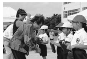
地域の方が参加する種目