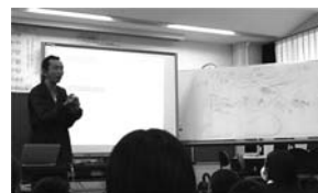
NGO 関係者による授業