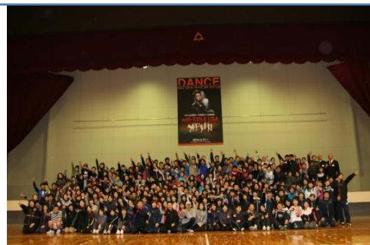
○EXILE USA氏によるダンス研修会（県内教職員対象 一般公開）