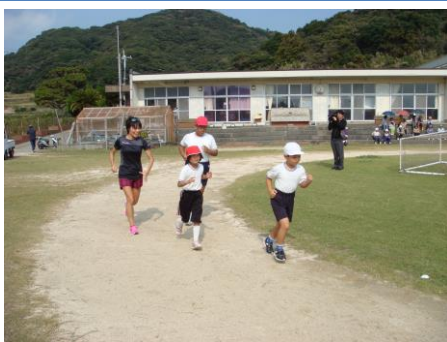
○マラソンのトップアスリートから走り方の指導を受ける。～地域の方も参加～（小学校）

平成25年度から、国の委託事業として実施した。今年度は事業の周知を図るためにも、県内公立小・中学校を対象とし、地域スポーツ指導者や著名なスポーツ選手等を派遣することにより、学校支援活動を展開している。今年度は小学校を中心に、地域スポーツ指導者22名が14市町57校に124回、授業における指導に協力した。また、大学生体育ボランティア36名、著名なスポーツ選手8名も体育科の授業等に協力し、学校における体育的活動を支援した。