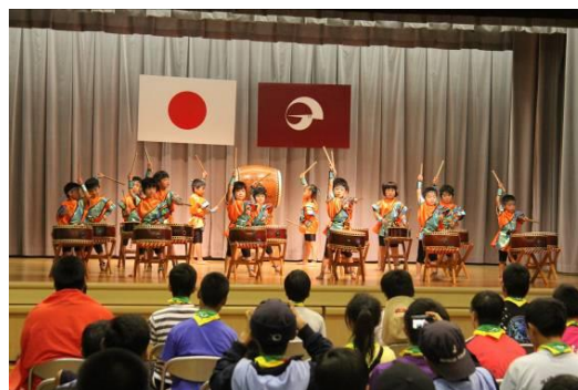
保育園（日本ジャンボリー地域プログラム）