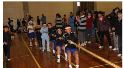
阿武町綱引き大会