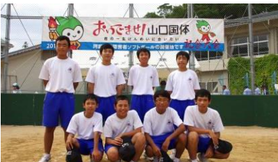
ソフトボール大会でのボランティア