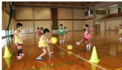
スポーツ少年団（保育園）