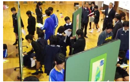
小中合同学習（図工・美術）