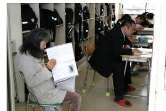
推進委員による授業参観会