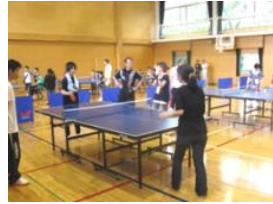
卓球・ホタルまつり：麦川小