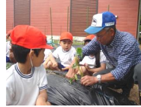
ふるさと麦川を学ぶ会：麦川小