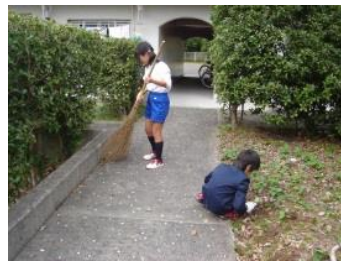
ありがとう作戦：麦川小