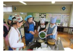
食生活改善推進委員との連携による調理実習：大嶺小