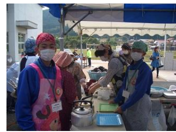
福祉の市への出店参加：大嶺中