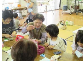
手づくりおもちゃ教室：重安小