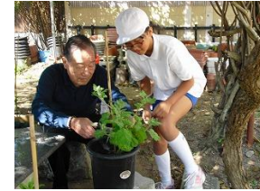
菊づくり教室：重安小