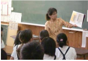
読み聞かせ：城原小