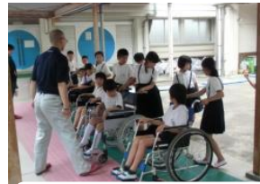
社会福祉協議会との連携による車椅子体験：大嶺小