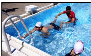
水泳技術指導(体育)