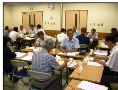
小・中合同学校運営協議会