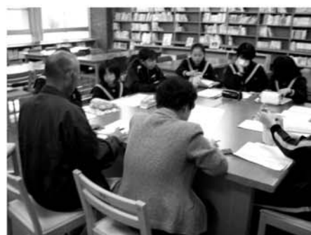
生徒と一緒に打合せ

「豊田中学校区ふるさと協育ネット」では、学校関係者や自治会、婦人会、社会教育団体、地域振興団体、青少年健全育成団体、各小学校協育ネット及び地域の方々など、豊田中学校への学校支援活動に協力できる方を幅広く募集し、積極的なボランティア登録を呼びかけました。「地域の情熱で学校教育をより充実させたい」というスローガンのもと、地域ぐるみで子どもを育てる体制を構築するという目的に多くの方が賛同され、発足式には 37 名が参加しました。式では、中学校での当面のニーズにはどのようなものがあるかなど、今後の活動に向けた具体的な計画が話し合われました。