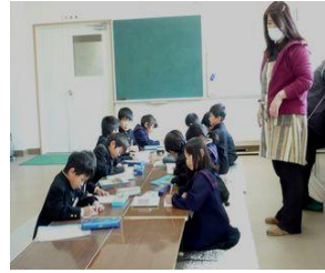
放課後子ども教室