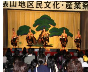
文化産業祭（子ども歌舞伎）