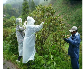
シャクナゲの花殻摘み体験