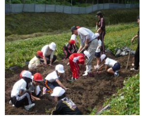
いも堀り体験交流