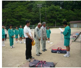
高齢者大学との交流