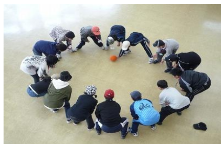
徳地アドベンチャープログラム

小学校を卒業した 6 年生やその保護者を対象に、PTA 主催により、毎年国立山口徳地青少年自然の家で、1泊2日の交歓会を行っています。お互いの学校紹介をした後、出会いの時間として卒業小学校に関係なく班に分かれ、協力しながら2日間を過ごしています。この2日間の活動が、中学校に進学してもスムーズに中学校生活に入っていけるためのきっかけづくりになっています。