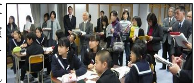
公開授業研究会 ～英語の時間～