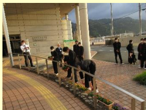
公共施設での花装飾