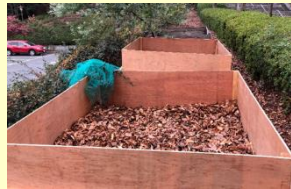
手作りコンポスト