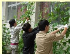
緑のカーテンの栽培