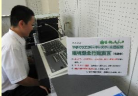
生徒会長による行動宣言