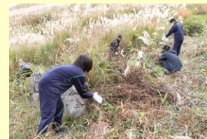
秋吉台の火道切り