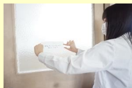
エコステッカーの貼り付け