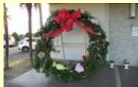
自然素材で作製したリース