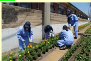
通学路の花壇の手入れ