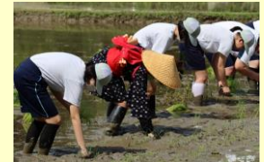
田植え行事「さのぼり」