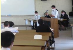
生徒総会での行動宣言