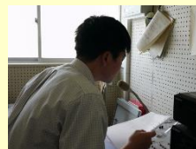
生徒会長による行動宣言