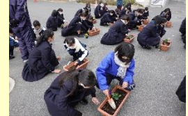
花いっぱい事業の様子