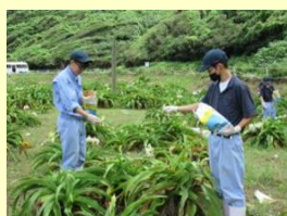
二位ノ浜の浜木綿保護活動