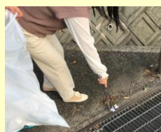
学校周辺の清掃活動