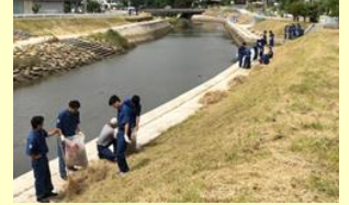
真綿川河川公園の清掃