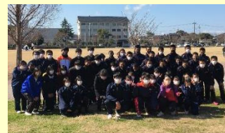
近隣学校との合同美化活動