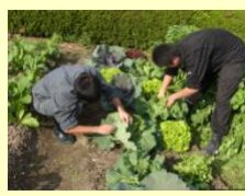
低農薬・低化学肥料栽培