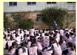
幸せますまちづくり運動