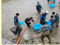
萩城跡の堀の清掃