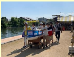
自作のソーラーボート