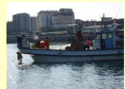
ナルトビエイの駆除