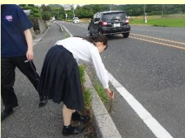
通学路や駅舎の清掃活動