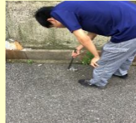
学校周辺の清掃活動