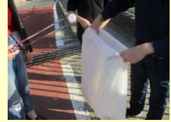
学校周辺の清掃活動