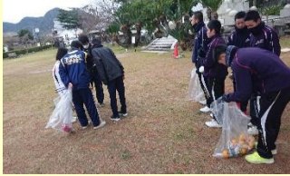
3校合同萩城跡の堀の清掃