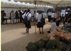
山農みのり館（ログハウス）販売実習