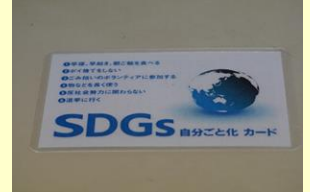
SDGs 自分ごと化カード