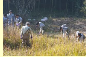
ピオトープの整備