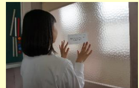
エコステッカーの貼り付け