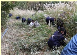
秋吉台山焼きの草刈り作業