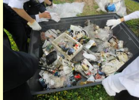
ゴミの分別の様子