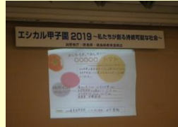
エシカル甲子園 2019 参加