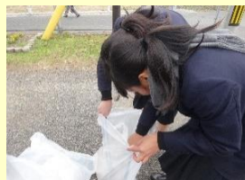
通学路や駅舎の清掃活動