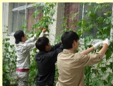
緑のカーテンの栽培