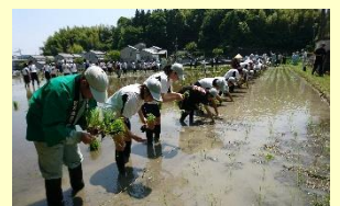
田植え行事「さのぼり」