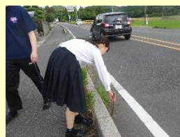
通学路や駅舎の清掃活動