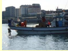
ナルトビエイの駆除