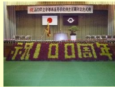
創立百周年記念式典における花装飾