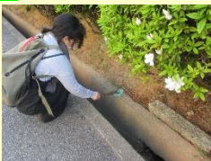
学校周辺の清掃活動