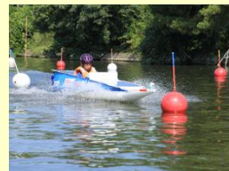
自作のソーラーボートでの大会出場