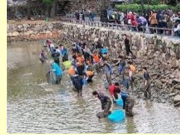
萩城跡の堀の清掃