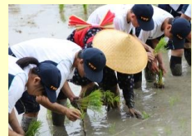
田植え行事「さのぼり」