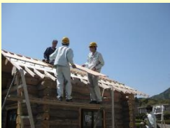
間伐材を利用したログハウスの製作