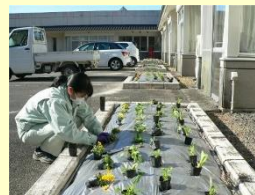
近隣の介護施設の花壇整備