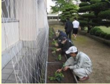
緑のカーテンの制作