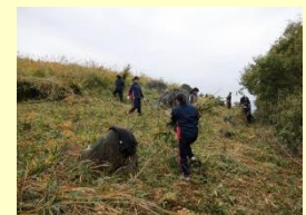
秋吉台山焼きの草刈り作業