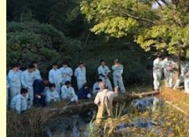
ビオトープの整備