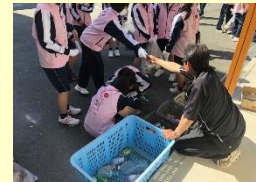
「幸せますまちづくり運動」におけるゴミ分別