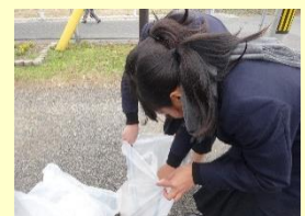
通学路や駅舎の清掃活動