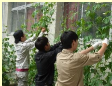
緑のカーテンの栽培