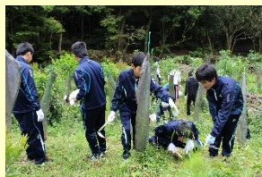
森林整備活動「エコピアの森下関」