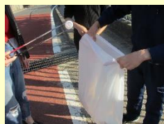
学校周辺の清掃活動