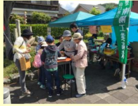
地域の行事への参加