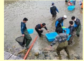
萩城跡の堀の清掃