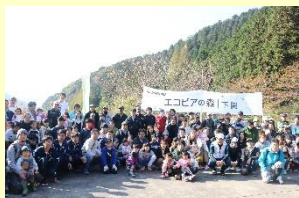
森林整備活動「エコピアの森下関」