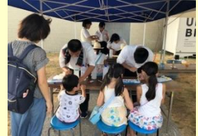
ときわサマーフェスタでの理科教室