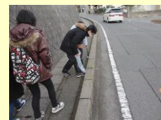
生徒会役員による学校周辺の清掃活動