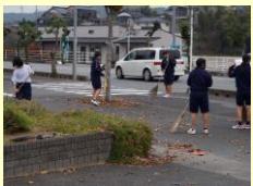
環境美化ボランティア