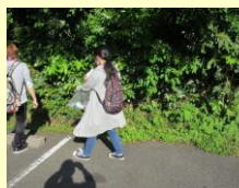
生徒会役員による学校周辺の清掃活動