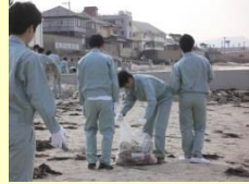
地域環境ボランティア（海岸清掃）