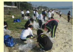
瀬戸内海環境保全大作戦