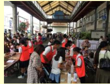
宇部祭りでの理科実験