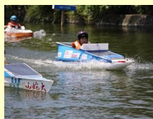
ソーラーボートの製作・運転