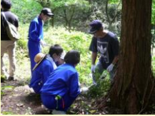
森林整備活動「エコビアの森下関」