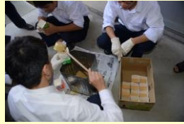
廃油石けんづくり