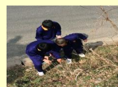
地域ボランティア