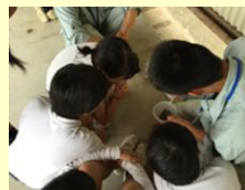
小学校でのものづくり教育（土質実験）