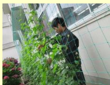
グリーンカーテンの栽培