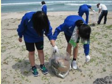
二位ノ浜の海岸清掃