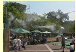
簡易型ミスト発生装置貸出