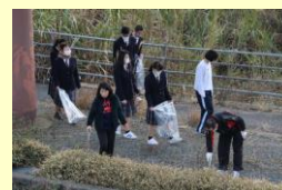
通学路等地域清掃