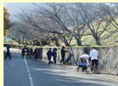
清掃ボランティア活動