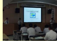
日本海南部地区生徒研究発表会