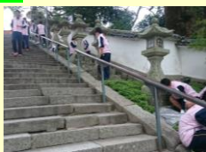
防府天満宮の清掃