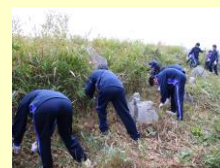
秋吉台の火道切り