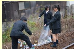
学校周辺の環境美化活動