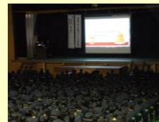
地域活性プラン発表会