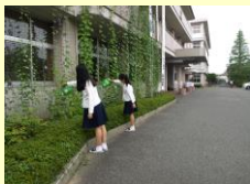
グリーンカーテン