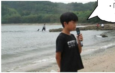
エコリーダー宣言

・東法湾の海の自然を守ります。 ・さわやかな神田の自然を大切にします。 ・「もったいない」を合言葉にゴミを減らす運動を続けます。