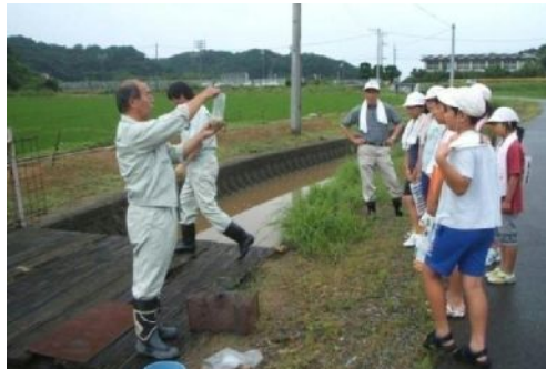
水土里ネットの指導を受け、神田地区の自然環境の調査