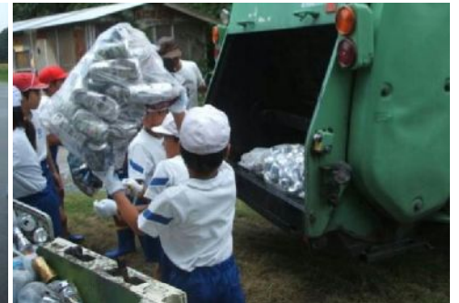
P T Aと一緒に回収