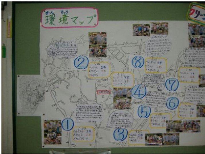
各地点のごみの種類と量の比較