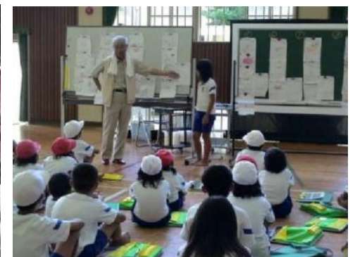
(潮だまりには何種類の生き物があるのかな スケッチしよう)