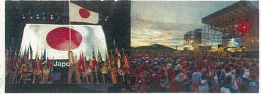
(プログラム) →県内生涯学習団体等の参画