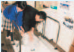
目標まであと何キロかな?

集められたプルタブは、高等部の作業学習の中で、磁石などを用いてアルミニウム製以外のものが除かれ、最終的には文房具などに交換されて、児童生徒会活動に活かされています。