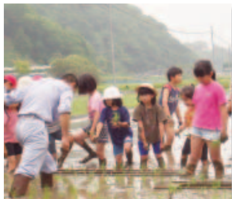
学習農園での田植え 桃木小学校区子ども教室(美祿市)