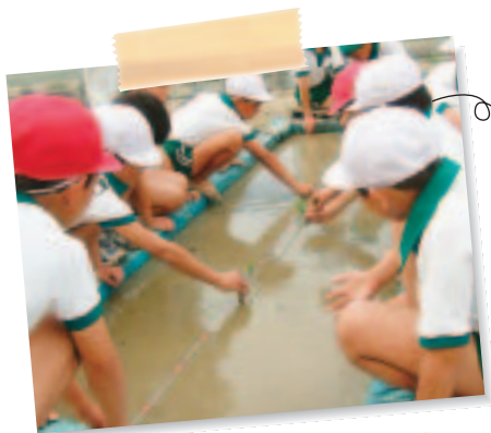
田植えの体験学習 (防府市立牟礼南小学校)

県教育委員会では、今年度から県内8校をモデル校に指定し、「子ども元気創造推進事業」を展開しています。たとえば、モデル校ではこのような取組みをしています。