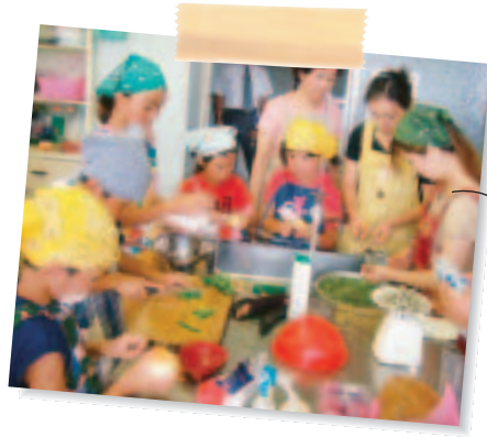
児童が育てた野菜を使った親子料理教室 (周南市立大道理小学校)