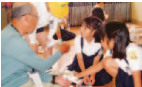
学校での紙飛行機づくり 放課後ひろば「山の田」(下関市)