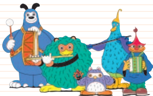
山口きららバンドも応援しています

国民文化祭やまぐち の大きな特色として、 次代を担う子どもたち の豊かな感性や創造 性をはぐくむための基 盤づくりを進めること としています。