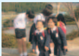
今日も元気なあいさつからスタート!