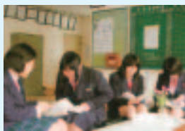
読書紹介カードで広がる読書の輪

6月から始めて10月まで、枚数にして203枚、冊数では141冊分のカードが集まりました。育友会報にも取り上げようと、保護者にも読書の輪は広がっています。