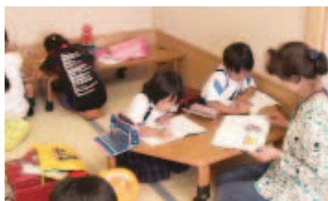
学校での学習タイム さくらふれあい教室(阿東町)