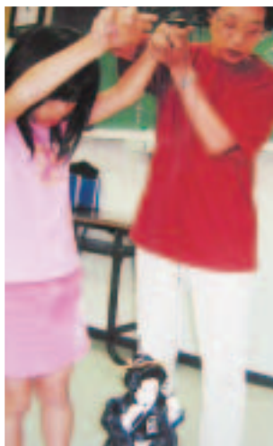
公民館での 糸あやつり人形の操作 安田の糸あやつり人形芝居教室 (周南市)