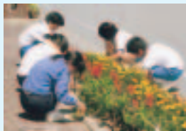
花壇の手入れ、心をこめて...

また、個人でも、「一日一回以上必ず発表する」「部活に一生懸命取り組み、きれいなフォームを身につける」など、「自分をステップアップする目標」を設定し、自らを高める努力をしています。