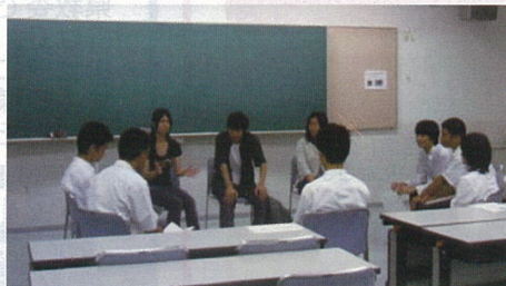
(大学生を囲む座談会)