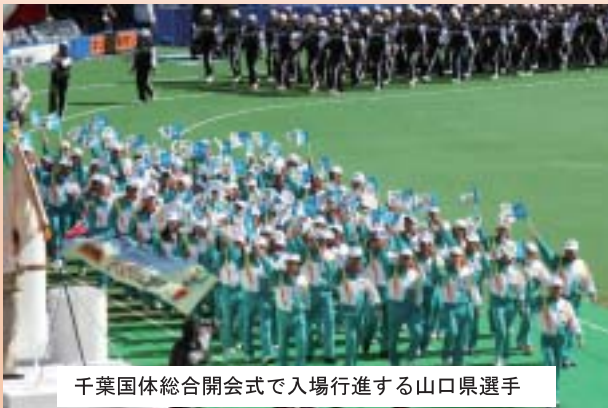
千葉国体総合開会式で入場行進する山口県選手

今年10月、48年ぶりの開催となる第66回国民体育大会「おいでませ!山口国体」には、全国から選手・監督等約22,000人が参加します。県内19すべての市町を会場に、陸上競技や水泳などの37の正式競技、公開競技の高等学校野球、ゲートボールやウォークなど県民の皆さんが参加できる19のスポーツ行事を行います。