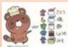
防府商マスコットキャラクター「ため防」です。これも生徒がデザインしました。