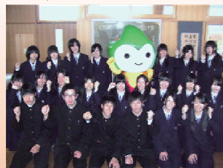
山口国体、山口大会に向けてがんばります！！

半世紀に一度の国体ですから、この機会に本校が目指している「前に踏み出す力」「考え抜く力」「チームで働く力」の育成につなげていこうと全校を挙げて取り組みます。これまでの地域ブランド開発「幸せます」の企画や「山頭火弁当」の製作の経験を生かした取組ができればと考えています。また、つまようじアートは、約7万本のつまようじを使って、縦1m、横1.6mの「自転車競技のちよるる」を製作します。