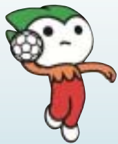
ハンドボール (少年男子) 県選抜チームが18年ぶりに優勝