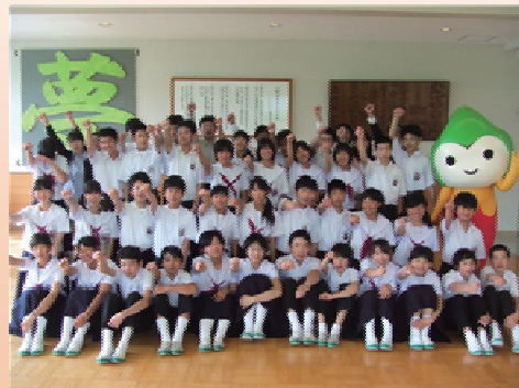
ボランティアがとっても楽しみ！！

いろいろな人に交じってのボランティア活動です。子どもたちにとっては、学校では体験できない人間関係を体験するよい機会となります。この豊かな体験がきっと子どもたちの心の成長につながると思います。