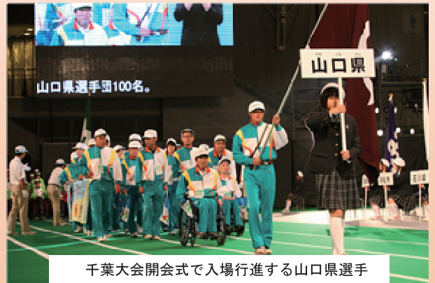
千葉大会開会式で入場行進する山口県選手

66の都道府県・政令市から約5,500人の選手団が参加し、県内8市を会場に、陸上競技や水泳などの13の正式競技、オープン競技の卓球バレーで力を競い合います。