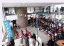
昨年度のステージイベントの様子