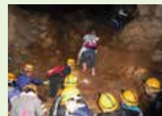
昨年度の地底湖探検の様子