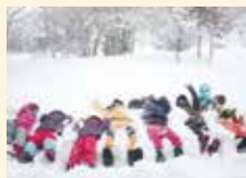
昨年度の冬山散策の様子