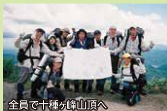
全員で十種ヶ峰山頂へ

「ペアレント」は、子どものプログラムの短縮版(3泊4日)を体験できるもので、参加者からは、「子どもと同じ体験をすることで、親子の共通の話題ができて良かった」、「共通の体験をした仲間は、一生の宝になった」等の感想があり、大人にとっても多くの学びのある充実した自然体験活動となっています。