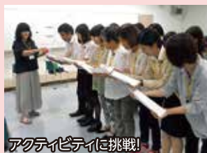
アクティビティに挑戦!

また、AFPYの取組の一つに「ふりかえり」があります。活動の中で自分や仲間について感じたこと、思ったことを集団の中で発表するなど、体験を通して学んだことを「ふりかえり」で整理することにより、各自の生活の色々な場面に活かすことができます。