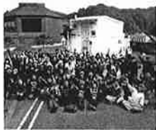
福島県の被災地にて災害ボランティアの方々と