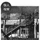
沖縄県水納島の防災訓練 沖縄県水納島(人口38名)の防災訓練に参加しました。小学校には津波対策として、屋上までの直通階段が作られていました。