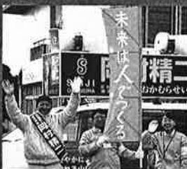
平成27年の県議会選挙にて

平成2年の衆議院議員選挙の時、初めて応援弁士をさせて頂いて以来、先生には長年にわたりご指導を頂きました。そして今、日本政界の重鎮として、ご活躍されている姿に、大きな誇りを感じています。