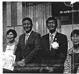
岸信夫衆議院議員と(中央左) 第53回山口県スポーツ・レクリエーションフェスティバルにて