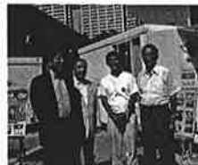
安倍総理・石原都知事と