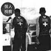
フィリピン・マニラ ライフガードの活動や日本語学校などを視察。フィリピンと日本の懸け橋になりたいと思いました。