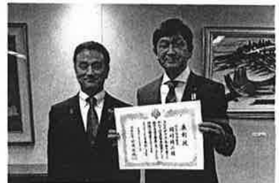
村岡知事より県議会議員在職15年表彰