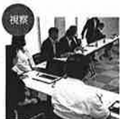
商工観光委員会視察 若国市の備カワトP.P.C.にて、住宅やマンションなどに使用される配管システムの合理化について視察しました。