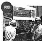
土木建築委員会 総務企画委員会視察 株式会社ウベカマ・工業用水用厚東川横断管工事現場を視察しました。