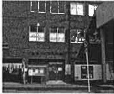
まちづくりプラザ

全国で初めて「男らしさ女らしさ」を認めた条例として、産経新聞の第一面に掲載され、全国的な話題となりました。