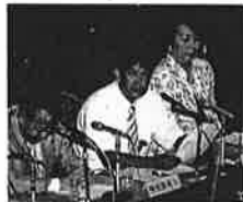
参議院・郵政民営化特別委員会にて