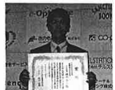
日本マニフェスト大賞授賞式にて