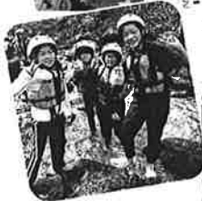
深坂自然の森宿泊学習で自然体験