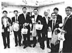
議員有志で上関町応援フェア!