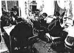
自宅を解放し「夜のお勉強会」