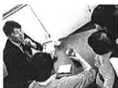
子育て世代のご夫婦と意見交換!

TEL/FAX (083)286-2013 ypp.gikai020009@35ypa.jp