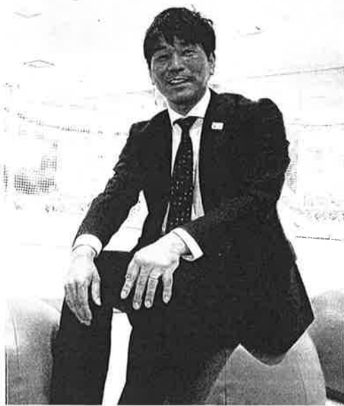
にて感染症対策をして行いました。