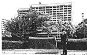
初心を貫く!県議として6年目を迎える。