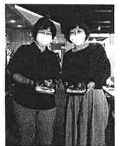
コロナ禍の今、お弁当でママさん、パパさん応援プロジェクト

今振り返れば、あの時すぐに行動へ移せたのも、日頃から地域の繋がりがあったからこそ! 予測不能な事態が起こっても、柔軟に対応できる準備の大切さを、コロナから学びました。