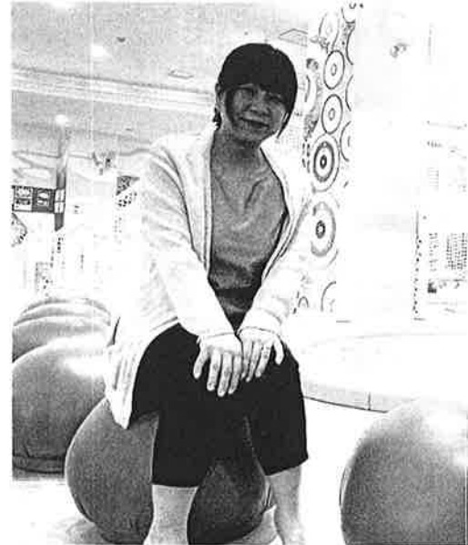
対談は3月15日、ふくふくこども館に