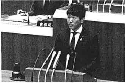
県議会一般質問に登壇。6項目を政策提言!