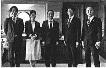
村岡県知事を囲み、若手県議で意見交換!