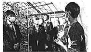
最先端農業(山口農業大学校)