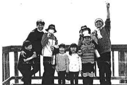
吉母富士登山で健康増進! 毘沙ノ島展望台も踏破!

西本 スポーツは、健康増進や心身の鍛錬はもとより、挨拶や礼儀など人間形成への寄与、また下関海響マラソンに象徴されるように地元経済への波及効果など、様々な役割や魅力を有しています。市長も公務多忙と思いますが、「政治家は身体が資本!」最近スポーツはしていますか?