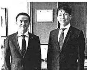
村岡県知事とガッチリ連携!次代をひらく。