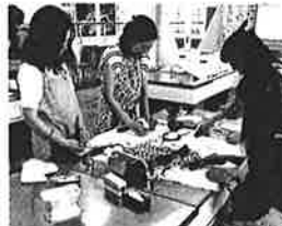
子育てに大変なママさんを応援する「さくらカフェ」きらきら

西本 現在、様々な調査で、家庭環境による生活困窮を指摘する声もありますが、この点は行政の責務として、より正確な実態把握