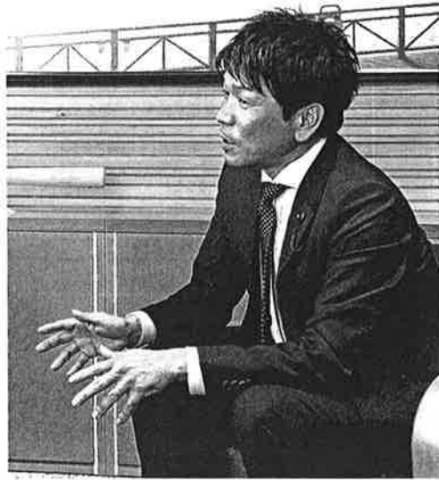
対談は11月4日、感染症対策を行い実施しました。