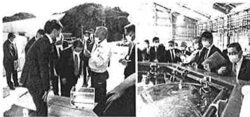
現場の声を県政に生かす! (下松市栽培漁業センター視察)