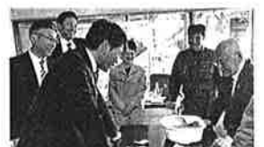
ウニ養殖実験場視察