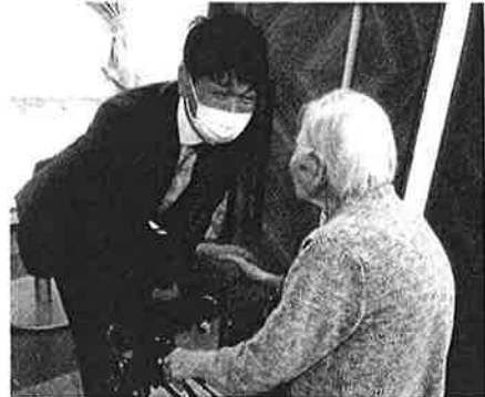
コロナや病気の無い元気で「強い下関」へ全力!

西本 コロナによって、社会経済活動への影響はもとより、市民の日常生活にも様々な不便やストレスが生じています...。本市経済の閉塞感や危機的状況を打破するためにも、市長への期待は大きい! コロナを乗り越え「希望の街・下関」へ向けての決意・覚悟を?