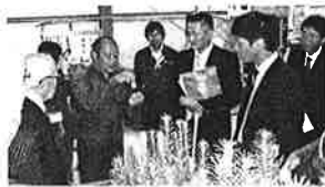
スマート林業導入調査