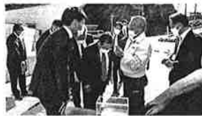
魚食普及へ!(下松栽培漁業センター)