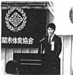
体育功労者へ謝意を伝える!