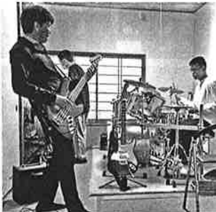
「うつつの里 手づくりコンサート」に向け、柴田兄弟と猛練習!