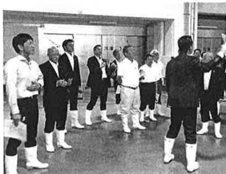
下関漁港に整備された高度衛生管理型荷さばき所を視察