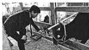
やまぐち和牛(からめ)を全国へ!