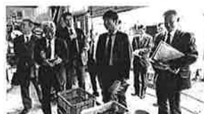
無農薬野菜の生産現場へ!