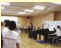
中学校での合唱指導の様子