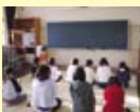
小学校でのお茶指導の様子