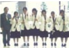
岩国商業高等学校クラリネット六重奏 (中国大会にて)

中国大会に進むチームの中には全国大会まで進むものも多くあり、防府市立国府中学校金管打楽器八重奏は平成十九年度に全国大会で金賞を受賞するという快挙を成し遂げました。他にも山口大学や岩国高等学校OB吹奏楽団、NEC山口吹奏楽団など、全国大会の常連に名を連ねている団体もあります。 連盟としては、山口県文化連盟の一員として、今後とも山口県の音楽文化の発展に寄与できまようように努力していく所存ですので、よろしくお願ひ申し上げます。