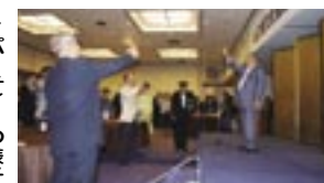
▶パーティーの様子

は、交流と出会によって文化に親しむ輪を一層広げていくことを目的に毎年開催しているもので、今年も多数の御参加をいただきました。参加された皆さんは、和気あいあいと語り合った