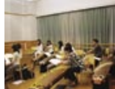
メインステージに向けた練習の様子