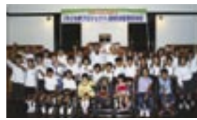
「子ども夢プロジェクト」採択決定書交付式風景