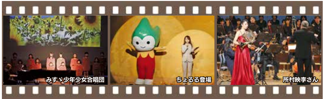
みすゞ少女少女合唱団