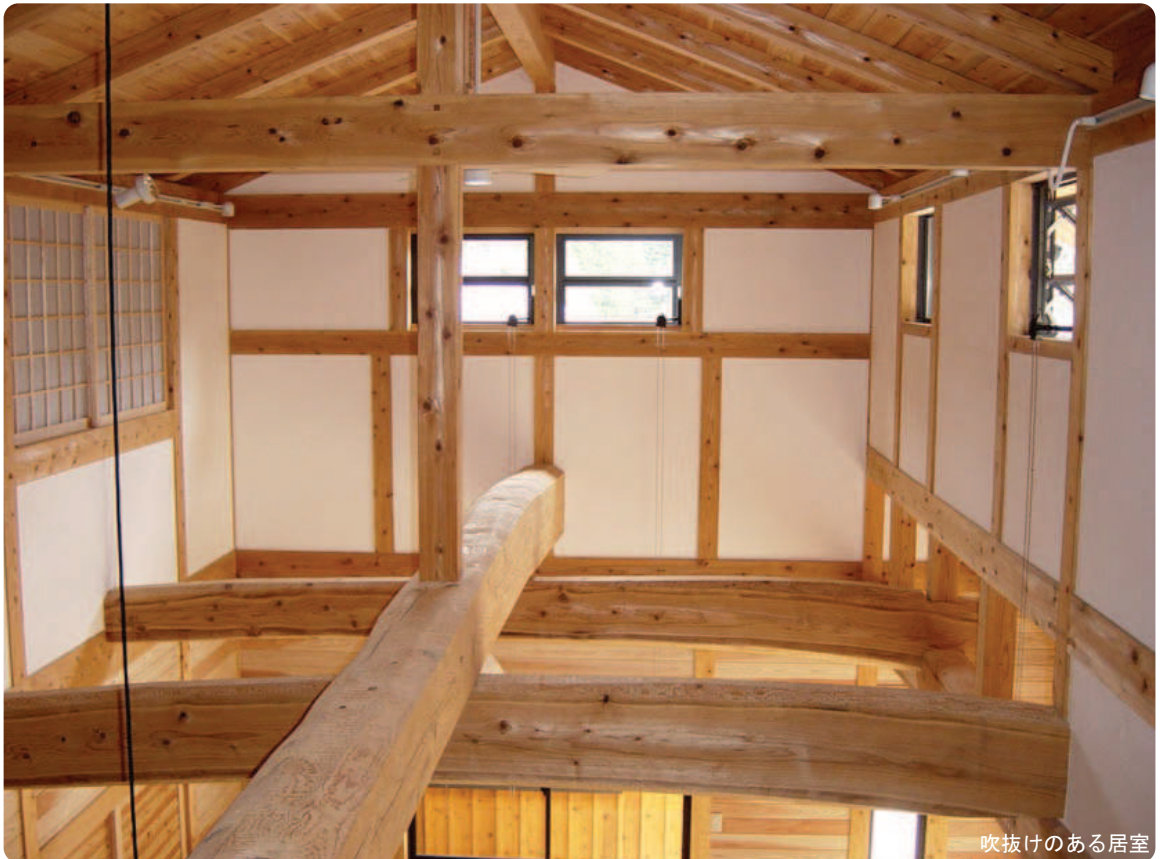
吹抜けのある居室