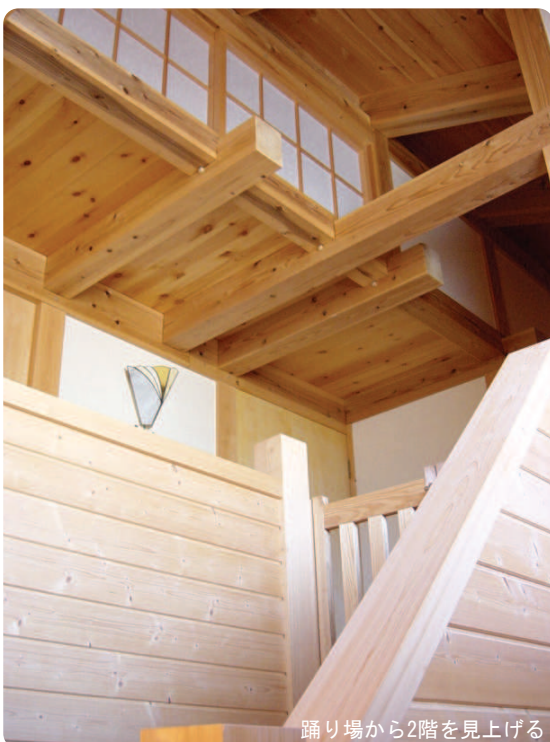
踊り場から2階を見上げる